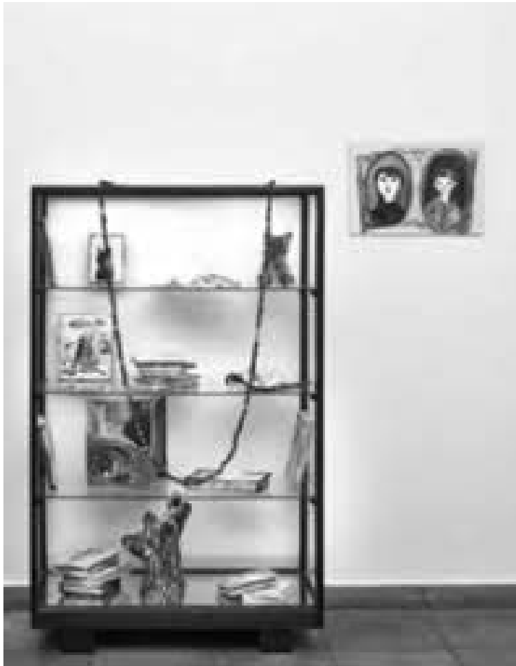
Vidriera 5. Débora Pierpaoli. Primer premio Fundación Klemm (2013)

de ingreso a conocimientos ocultos que resultan de su reutilización en nuevos contextos.