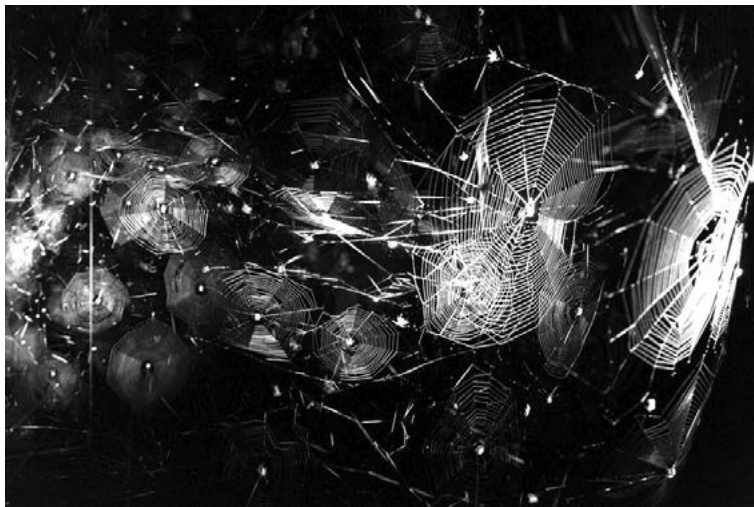
Figura 4. Exposición Cómo atrapar el mundo en una telaraña (2017), Tomás Saraceno. Museo de Arte Moderno de Buenos Aires (MAMBA)