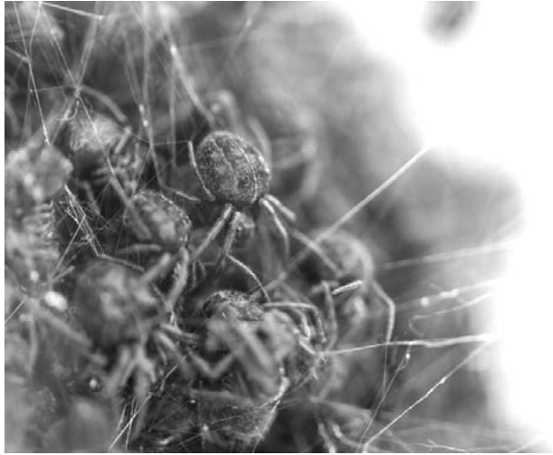
Figura 3. Exposición Cómo atrapar el mundo en una telaraña (2017), Tomás Saraceno. Museo de Arte Moderno de Buenos Aires (MAMBA)

oscuras, donde solo se puede ver una luz dirigida a la telaraña. Detrás de esta, se proyectan sobre una pared partículas de polvo cósmico, que se mueven como consecuencia del desplazamiento de los visitantes al entrar [Figura 4].