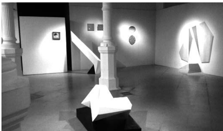
Figura 1. Exposición Paisaje Adyacente (2017). Museo de Arte Contemporáneo Latinoamericano.

Una vez dentro de ese espacio, se observa el texto de sala a un lado de la puerta. Este texto es grande, tipografía legible, extensión medida, a la altura apropiada para la vista, sin embargo, resulta difícil de comprender debido al uso de vocabulario específico. La muestra presenta diecinueve obras de cinco artistas distintos, de las cuales dos son tridimensionales —esculturas— y las restantes diecisiete de formato bidimensional sobre diferentes soportes como madera y lienzo. Se destaca el montaje, ya que por momentos las obras se presentan en grupos, por momentos solas, y también en comunión con la arquitectura de la sala. Si bien el objetivo de la muestra no está explicitado, se lo puede deducir teniendo en cuenta el texto de sala y el título de la exposición. La misión es destacar la idea central de la abstracción geométrica, porque se buscó que el diseño museográfico funcione como un todo, haciendo que las paredes, el piso y las obras se conecten entre sí a partir del juego de líneas y de adyacencias [Figura 1].