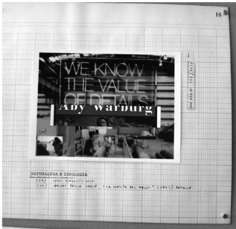
Figura 1. Doc. AIA N.º 116/2016, toma directa de la exhibición (este documento visual es una de las fichas que componen la instalación A.I.A)

A este recorte extraído de la página de Tenaris, Molinari superpone un fragmento de una tapa de un libro de un historiador del arte. Se trata de Aby Warburg quien con Atlas Mnemosyne (1924-1929) propuso, a principios del siglo XX, pensar en las imágenes por fuera del orden cronológico al presentar su archivo visual en paneles temáticos. Esto supone un marco epistemológico diferente de los marcos modernos, no solo de la historia, sino también del arte, que es concebido como constelación de fragmentos, desde los cortes y las rupturas, irreductibles a un conjunto cerrado, homogéneo y ordenado. Con sus paneles, Warburg incitó a repensar el espacio y el tiempo, jugó a desarmarlos y a proponer relaciones insólitas. No hay allí historia discursiva lineal, sino que en lo inesperado de sus agrupaciones surgen el distanciamiento y el extrañamiento. Estas últimas experiencias pueden ubicarse como el desplazamiento del juego que plantea Rancière (2016). Por lo tanto, podríamos decir que la ficha 116 que nos presenta Molinari invita a movernos desde el silenciamiento de los signos puestos a funcionar de otra forma. Esta indecibilidad que se arroja a la mirada del espectador no