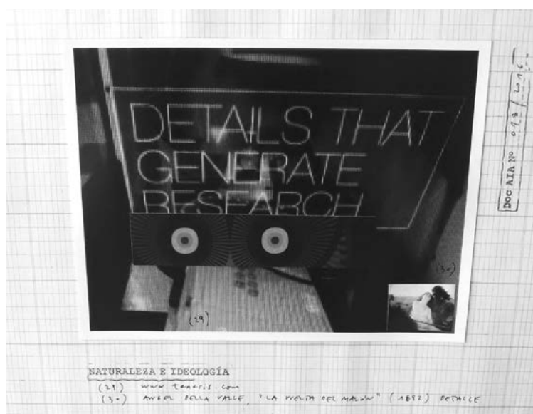
Figura 2. Doc. AIA N° 118/2016, toma directa de la exhibición (este documento visual es una de las fichas que componen la instalación A.I.A)

se agota, tal vez, en la parodia o en el humor, porque el desplazamiento del inventario, implícito en la obra, prescribe el tomar conciencia de lo indecible a partir de la presentación y del ordenamiento de las imágenes. En la ficha 118 podemos observar desplazamientos similares: a partir del juego el significado de otra frase (¿o tal vez la continuación de la ficha 116?) tomada de la misma página, «Details that generate research», vuelve a quedar suspendido a partir de la puesta en relación con un fragmento del búho que es marca visual del Banco Hipotecario y con un reencuadre de la pintura La vuelta del Malón (1892), de Ángel Della Valle. 5 El tamaño de la reproducción remite a una etiqueta, semejante a una estampilla. Este reencuadre también aparece ubicado en la esquina de un cuadrante de la ficha 116. La imagen lúdica sale al encuentro de lo indecible porque el significado original de la circulación de estas imágenes queda liberado: ¿De qué significados se libra la frase al ponerse en diálogo con la marca del banco? ¿Qué juego emerge a partir de la catalogación de estas fichas con la pintura/estampilla de Della Valle?