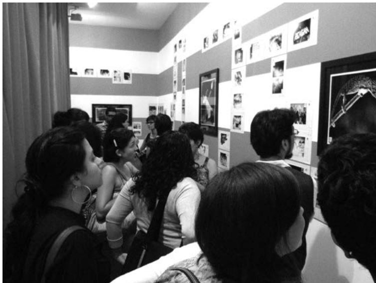
Figura 3. Visitantes frente a los trucos de magia de El Camaleón (2011). Fotografía tomada del blog del artista

En El Camaleón (2011) los trucos de magia operan el juego a partir de la puesta en suspenso de los mecanismos de dominación de la imagen en su circulación como mercancía. La instalación se divide en cuatro trucos que intentan mantenernos en una vida ilusoria y que nos alejan de vincularnos críticamente con ella. Los cuatro pases de magia son: invisibilización, levitación, camuflaje y disfraz. De este modo, Molinari selecciona diferentes archivos intervenidos que conforman la totalidad de un circuito a transitar. Son distintas imágenes que originalmente no coincidieron temporalmente, tampoco en su soporte, ni en su circulación. Montar estas diferentes visualidades le permite activar una mirada crítica que se pone en juego cuando el espectador se deja sorprender; los trucos de magia develan lo indecible que nos atraviesa «en nuestras vidas contemporáneas al interior del semiocapitalismo» (Eduardo Molinari, 2011a).