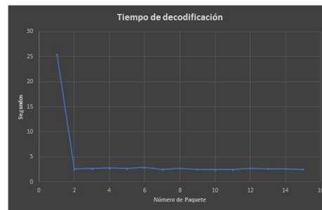
Figura 3. Tiempo de decodificación

La figura 3 muestra los tiempos de procesamiento para un conjunto de simulación de 15 paquetes con 5000 variables de telemetría cada uno, cantidad compatible con un satélite científico de envergadura (Ejemplo SABIAMAR http://www.conae.gov.ar/index.php/espanol/introduccion-sace ).