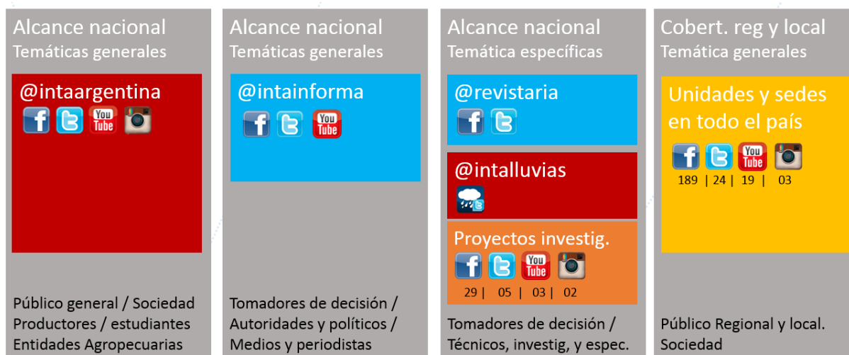
Gráfico N° 1. Estructura de redes sociales en INTA

Su correlato en redes se expande en 275 puntos o redes INTA. En función del público objetivo proyectado para el alcance y la especialización temática, se pueden clasificar en cuatro grupos (Gráfico N° 1):