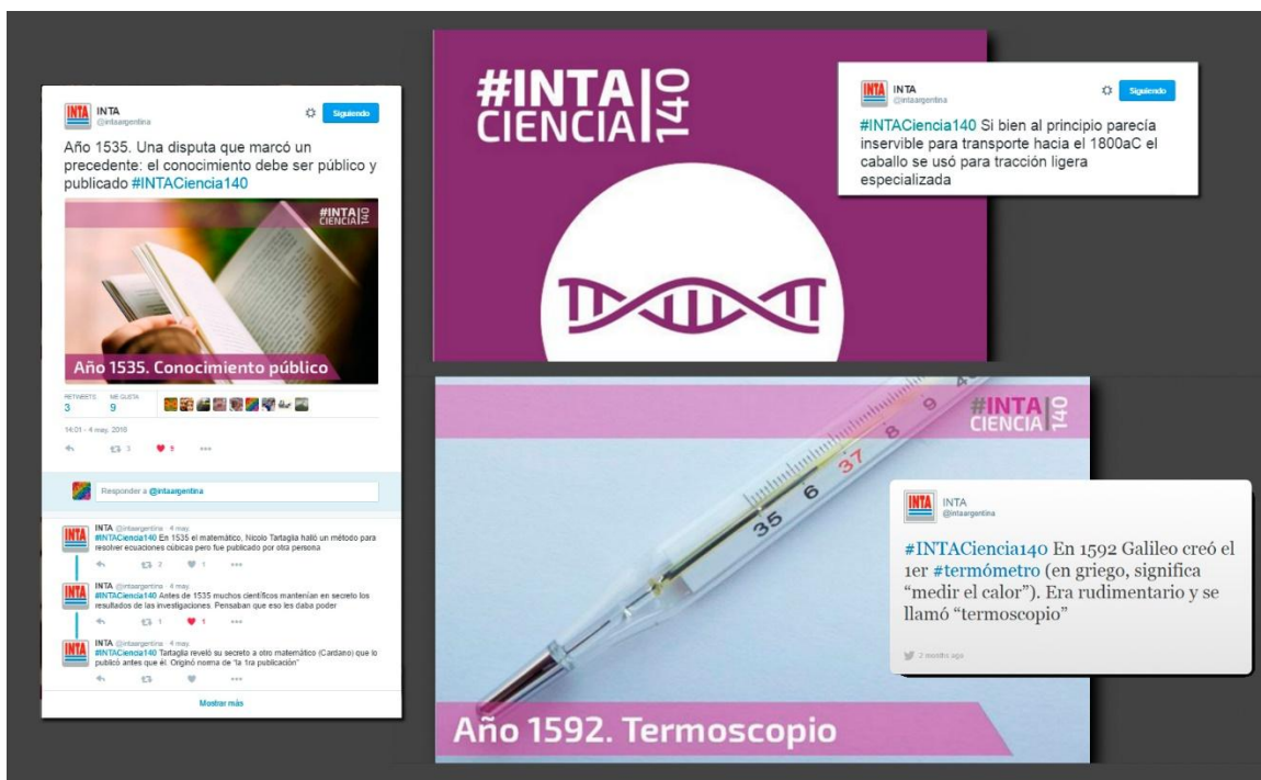
Gráfico N° 3. Vistas de tuits y slideshow de la campaña #INTACiencia140

una lectura secuencial, como si fuesen páginas dentro de un capítulo en el que el itinerario de lectura muestra la evolución de los descubrimientos científicos. Para contribuir a la lectura secuencial y dado su carácter histórico, se creó una colección como línea de tiempo goo.gl/k3mDUI , que reúne a todos los posteos realizados, y además una versión tipo diapositivas, slideshow de Storify 2 goo.gl/aod52o que permite una lectura continuada, sin los saltos del timeline 3 de Twitter.