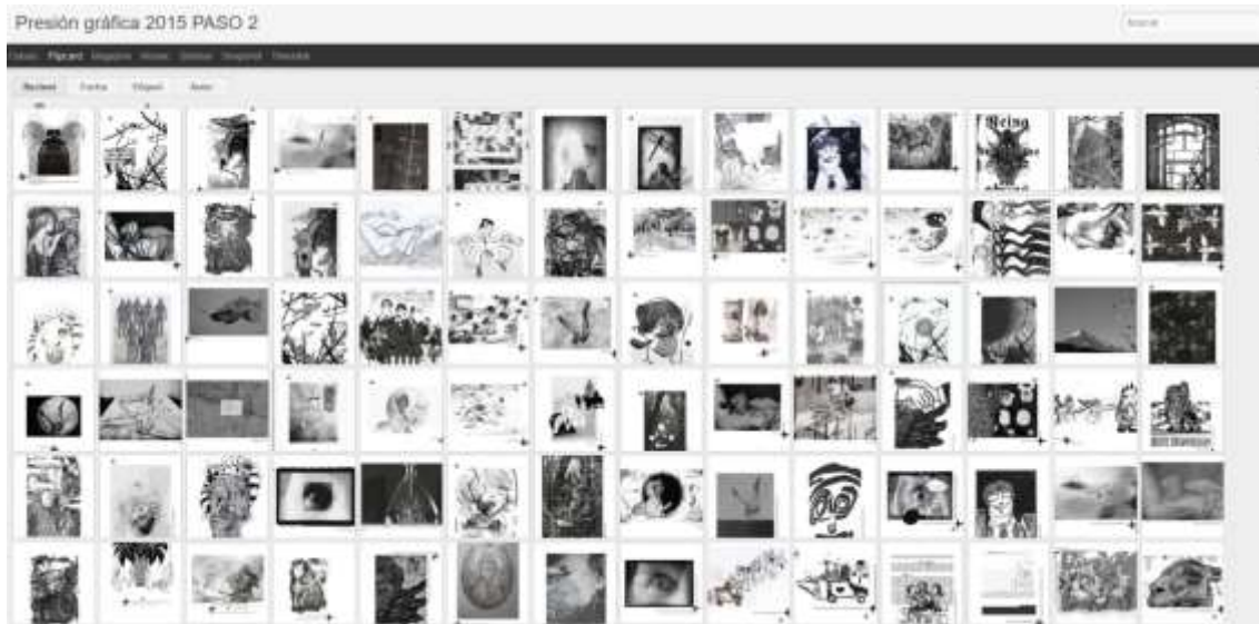
Figura 3. Captura de pantalla del archivo virtual online de las reversiones del Remixado Gráfico (2015). En: http://presiongrafica2015paso2.blogspot.com.ar/ (Fecha de consulta: 20/04/2018)

Las nuevas imágenes llevan los nombres tanto del autor o autores de las imágenes iniciales como del que realizó la nueva versión. En este proceso desaparece así el lugar de receptor pasivo y, como señala Blas Benito, “[...] la creación de la obra deviene en una permanente inconclusión. [...] el artista único deja paso a un nuevo modelo de creador colectivo [...] capaz de alterar sin limitaciones un resultado hipotético” 25 . En cuanto a los derechos de imagen los organizadores aclaraban en la convocatoria que el juego funcionaba con criterios de licencia Creative Commons 26 y que “el proyecto se enmarcaba en conceptos como obras culturales libres y copyleft ” (Figura 4). Para ello se solicitaba que al momento de enviar las imágenes el autor explicita su conformidad con el libre uso de las mismas. Además del remixado vía internet, realizaron un remixado presencial durante el desarrollo del festival, para lo cual las personas eran convocadas a descargar e imprimir las imágenes que quisieran para realizar el reversionado en vivo mediante procedimientos manuales como cortar, pegar, rallar, escrachar, saltar, pintar, repetir, anular, etc. 27