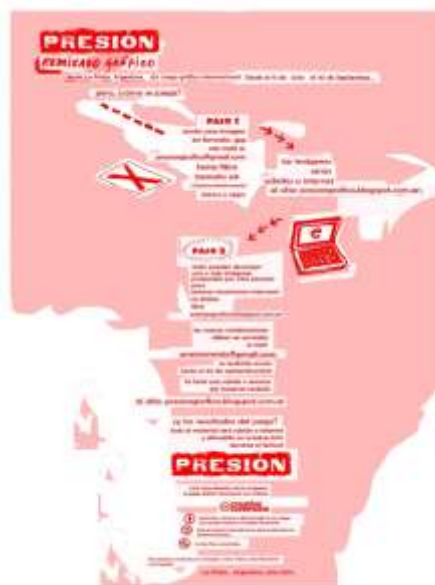
Figura 4. Flyer con las instrucciones para participar del Remixado Gráfico, juego gráfico internacional (2015). En http://4.bp.blogspot.com/-HSMCRAPMbvA/Vaw180rSZBI/AAAAAAAAABO0/hbQz7m1w54U/s1600/basesweb.jpg (Fecha de consulta: 20/04/2018)

La edición 2017, menciona Florencia Basso integrante del grupo gestor, tuvo “dos componentes: por un lado, ‘Que se rompa la burbuja’ que es como la frase inspiradora, la idea a la que apuntamos; y por otro, ‘Gráfica a la canasta’ que vendría a ser el procedimiento, cómo elaboramos las imágenes” 28 . A su vez señala