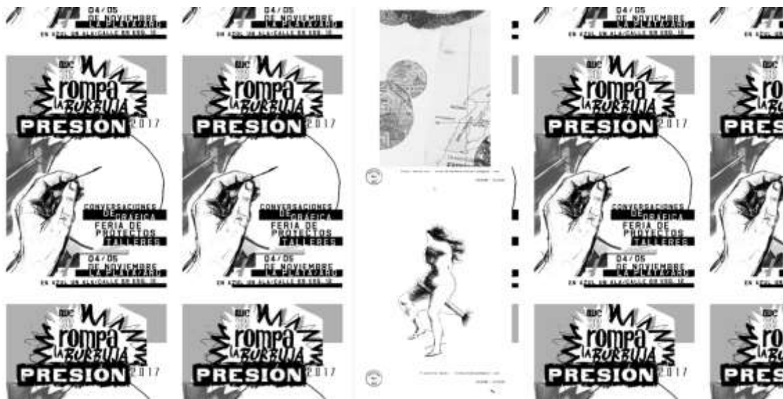
Figura 6. Captura de pantalla del archivo virtual de fragmentos de la Canasta Gráfica (2017). En: http://presiongrafica2017.blogspot.com.ar/p/imagenes-enviadas-presion-la-canasta.html (Fecha de consulta: 20/04/2018)

imágenes, pensando prácticas diferentes, nuevas formas de hacer imágenes, nuevos juegos... 34 .