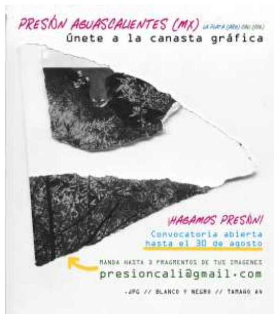
Figura 5. Flyer de la convocatoria a la Canasta Gráfica , Presión Aguascalientes, México; La Plata, Argentina y Cali, Colombia (2017). En: https://www.facebook.com/casalosfuegos/photos/a.176827562725150.1073741828.176166832791223/295115537563018/?type=3&theater (Fecha de consulta: 20/04/2018)

Una particularidad de esta edición fue que se convocó tanto desde Presión La Plata , como en las ediciones anteriores las anteriores, como desde Presión Cali (Colombia) y Presión Aguascalientes (México) (Figura 5). Los organizadores señalan: “[...] queremos llenar la canasta gráfica de materia prima para futuras re-mezclas. Necesitamos un trozo de tus imágenes, un retazo en formato .JPG blanco y negro [...] En Presión La Plata (Argentina), Cali (Colombia) y Aguascalientes (México) usaremos los retazos de imágenes para experiencias de producción de imágenes colectivas” 32 .