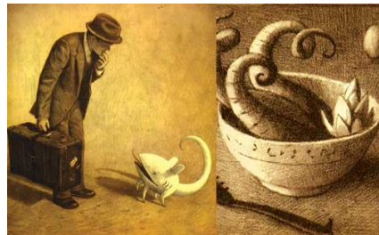
El manuscrito de Voynich