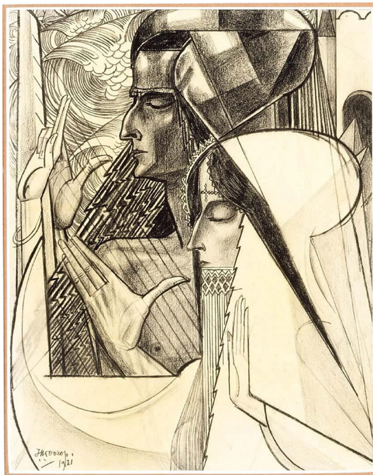
Figura 5. Meditatie (1921), Jan Toorop, desenho em giz preto. Sem referência ao local