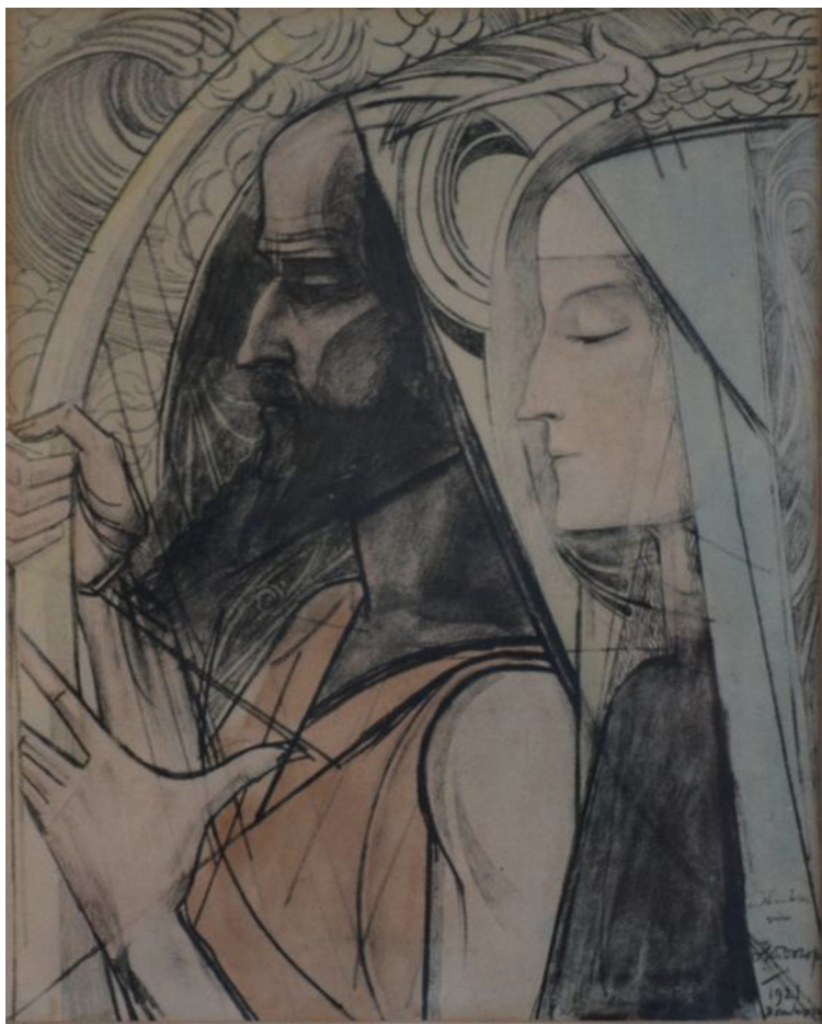
Figura 4. De Harpspeler (1921), Jan Toorop, litografia colorida. Sem referência ao local

Em Meditatie (Meditação), também de 1921, o ornamento da onda é construído de forma quase idêntica ao da carta. O uso das ondas nessas imagens parece carregar um sentido de movimentação, de instabilidade que traz em si o potencial da mudança [Figura 5].