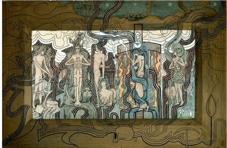
Figura 3. Zang Der Tijden (1893), Jan Toorop, giz e lápis em papelão. Rijksmuseum Kröller-Müller

Ao enxergarmos o desenho da carta como um recorte desta obra, abrem-se novas interpretações. A forma rígida é, na verdade uma cruz, em cuja extremidade um furo é deixado. A cruz pode representar o elemento intermediário que liga o plano terrestre ao superior. Ao identificarmos a cruz, podemos dizer que o espinho que a envolve é facilmente assimilado na representação bíblica. Do furo da cruz cai o sangue, que se transmuta em flor. A iconografia cristã traz a imagem da rosa que surge do sangue, para se transformarem um signo de renascimento e regeneração. O cabelo em torno do corpo mostra a nudez, simbolizando talvez uma fragilidade espiritual, que começa a ser envolvida e coberta. A nuvem na parte de cima contribui para a sensação de uma atmosfera transcendental. Vale acrescentar que é em 1893 que Toorop realiza uma de suas mais famosas obras, De drie bruiden (As três noivas), também um desenho.