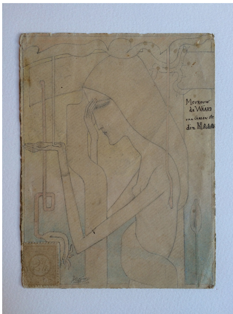
Figura 2. Carta-desenho (1893), Jan Toorop. Fondation Custodia.

Na coleção holandesa, há outro exemplar desenhado do artista, que está sobre o envelope de uma carta de 1893. A partir desses dois materiais, alguns pontos podem ser elencados [Figura 2].