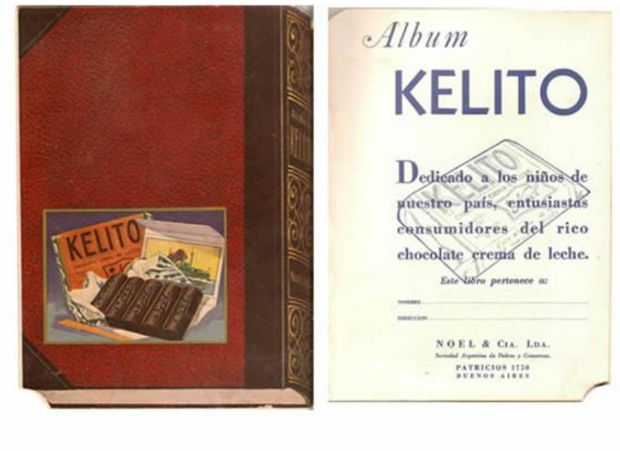
Noel y Cía. Álbum Kelito , 1932.

En 1936, la fábrica Noel apostaba también fuertemente a los chocolatines infantiles, colocando la publicidad de los “Kelito” en la portada de su catálogo de productos y precios corrientes de dicho año. La empresa se comprometía a sortear 2 pequeños autos por mes y 200 premios de $5 m/n cada uno entre los consumidores. Estos novedosos premios prometían atraer más consumidores que nunca, y con ese anzuelo los fabricantes esperaban que los almaceneros y comerciantes al por menor sugirieran los productos exhibiéndolos vistosamente: “Nunca venderá Ud. Más chocolatines que este año si se provee de “KELITOS” y se preocupa de exhibir los carteles y distribuir los prospectos que le mandaremos, con fotos de los autos y las bases del concurso” (Imagen 11). En 1932, el álbum Kelito, “dedicado a los niños de nuestro país, entusiastas consumidores del rico chocolate crema de leche” fue sobre clubes de fútbol. Las calcomanías eran ilustradas con los jugadores más reconocidos, y el desafío era completar los equipos (Imagen 12) 18 .