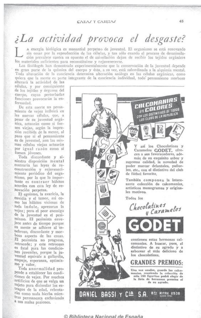
CyC, 18/9/1937: “los Chocolatines y Caramelos GODET, ofrecen a sus favorecedores, además de su exquisito sabor y suprema calidad, la novedad de poder marcar delantales, pañuelos, etc., con el distintivo del club de fútbol favorito. (...) guarde las calcomanías, reuniendo la colección de sólo 150 figuritas podrá elegir de la lista de hermosos premios.”

En efecto, la gran apuesta publicitaria de las fábricas de dulces en los años 30 fue la conquista del consumo infantil, ahora dirigiéndose directamente a los niños, y la característica saliente de esta década fue la emergencia de los niños como agentes de consumo. En ese sentido, se desarrolló una tendencia que ya había aparecido de forma incipiente en los anuncios de dulces en los años 20, en el marco de un fenómeno más amplio de emergencia de los niños como consumidores, a quienes habían apostado ya otras empresas, como es el caso de Billiken que abrió el camino de los “niños consumidores”, no sólo de lecturas sino también de otros productos (Bontempo, 2012, 2015; Scheinkman, 2017b). De forma novedosa, las publicidades del periodo se destinaron y dirigieron ya no a las madres, sino directamente a los niños como sujetos de consumo a los que era necesario conquistar. En 1938, en el diario ilustrado El Mundo , Nestlé hablaba directamente a los niños lectores: “Chicos: Uds. pueden ganarse una magnífica bicicleta de premio tomando parte en el concurso de Agosto de los Chocolatines Nestlé” (Imagen 6). Pocos años después, los chocolatines Águila se publicitaban de la misma manera: “Chicos!!! El chocolatín Águila les ofrece las estampillas más maravillosas del mundo... el más interesante e instructivo de los pasatiempos” (Imagen 7). Si por un lado las publicidades esperaban estimular los deseos de los pequeños, y por su intermedio, influir en el gasto familiar provocando la compra,