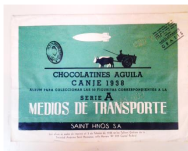
Álbum de figuritas Serie A. Medios de transporte, 1938