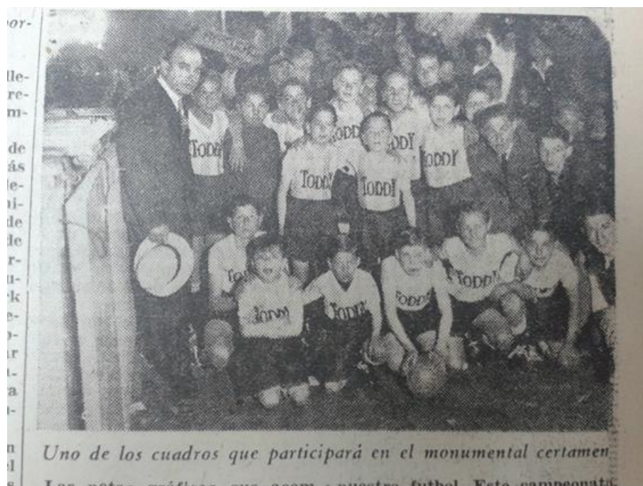
Gran Campeonato Toddy.

“Campeonato Toddy”, La Hora , 24/11/1941.