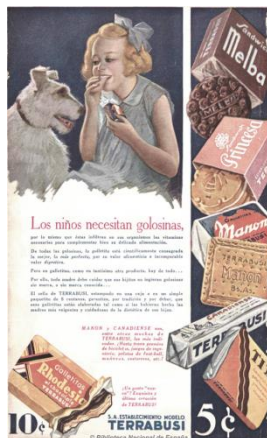
CyC , 28/3/1936