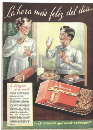
CyC , 10/6/1939

La fábrica Ferrabusi publicitó asimismo en 1936 sus productos característicos (las galletitas Melba, Manon, y las obleas bañadas en chocolate Tita y Rhodesia, entre otros), con la imagen de una niña