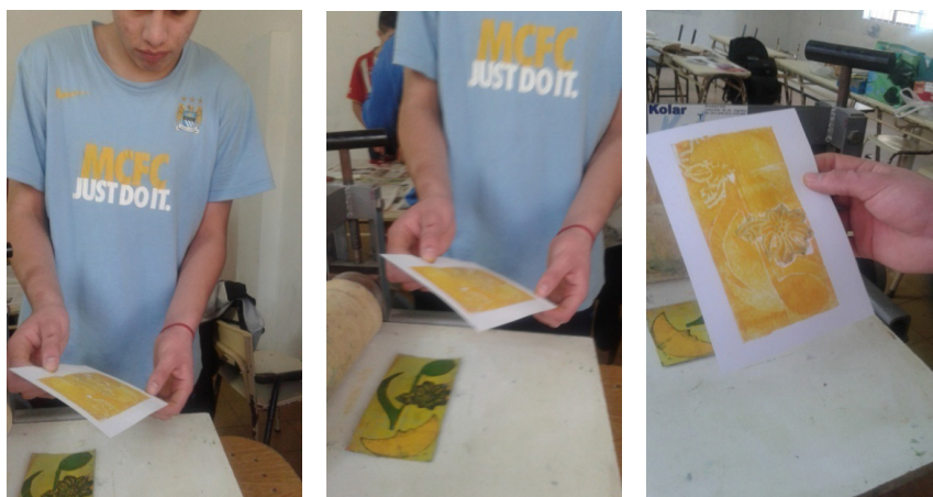
Figura 1: Joven estudiante realizando experiencias gráficas con tintas gráficas y materiales posibles de entintar, logrando impresos sobre papel

Los impresos resultan ser un caso especial entre los medios artísticos; la gran diversidad de técnicas y materiales que se utilizan para ello lo convierte en un medio particularmente flexible y lleno de recursos, que ofrece numerosas posibilidades de experimentación y expresión. Las estampas o impresos obtenidos fueron posteriormente las páginas de agendas anuales.