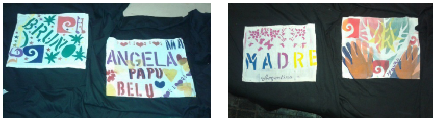
Figura 3: Telas impresas con plantillas o stenciles, luego se convirtieron en bolsas

Remeras: el conocimiento de sistema de impresión por estarcido y su práctica los preparó para el siguiente trabajo que fue la estampación en remeras. La práctica permitió una mayor formación y capacitación en la impresión. Hicieron registros y realizaron nuevos diseños, superpusieron plantillas con un conocimiento más elaborado, más preciso.