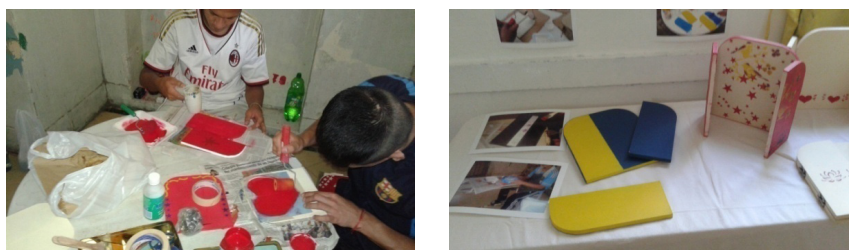
Figura 6: Realización de los objetos: retablos

Objetos: Retablos . Las producciones finales buscaron generar objetos que los proyecten hacia la comunidad, e imaginar la continuidad del taller, más allá de los límites del encierro. Los jóvenes solicitaron hacer en estas clases restantes del año unos retablos. La técnica de impresión también fue la de estarcidos: cada uno de los estudiantes diseño su imagen para el objeto a imprimir.