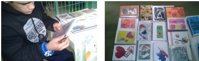
Figura 2 armado con las estampas o impresos agendas anuales

Las clases se iniciaban con mates y facturas a modo de desayuno, momento propicio para el diálogo y propuesta del trabajo diario.