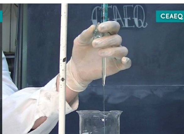
Correcta utilización de una bureta.