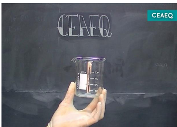
Presentación de material de vidrio.

El adecuado uso del instrumental de laboratorio desde los inicios de la trayectoria de grado resulta fundamental, y consideramos que conocerlo permitiría la autonomía de los estudiantes durante los trabajos experimentales, fomentando una participación activa. Por este motivo, se decidió la incorporación de un video-capítulo que demuestra la correcta utilización de buretas, pipetas, propipetas, entre otros.