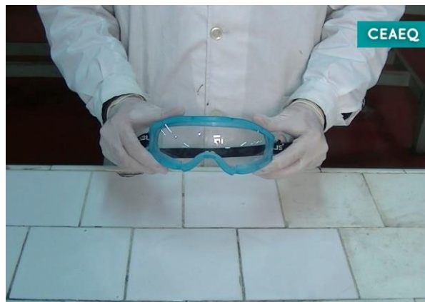
Gafas, guantes y guardapolvo.

en cuenta en el laboratorio para trabajar de manera segura, evitando posibles accidentes. Entre las medidas de seguridad mencionadas se destacan el uso de la indumentaria correcta (gafas, guardapolvo, guantes, calzado cerrado, etc.) y el cabello largo recogido. Puede observarse también, una mesada limpia y despejada, libre de objetos que no estén relacionados directamente con la actividad que se va a realizar.