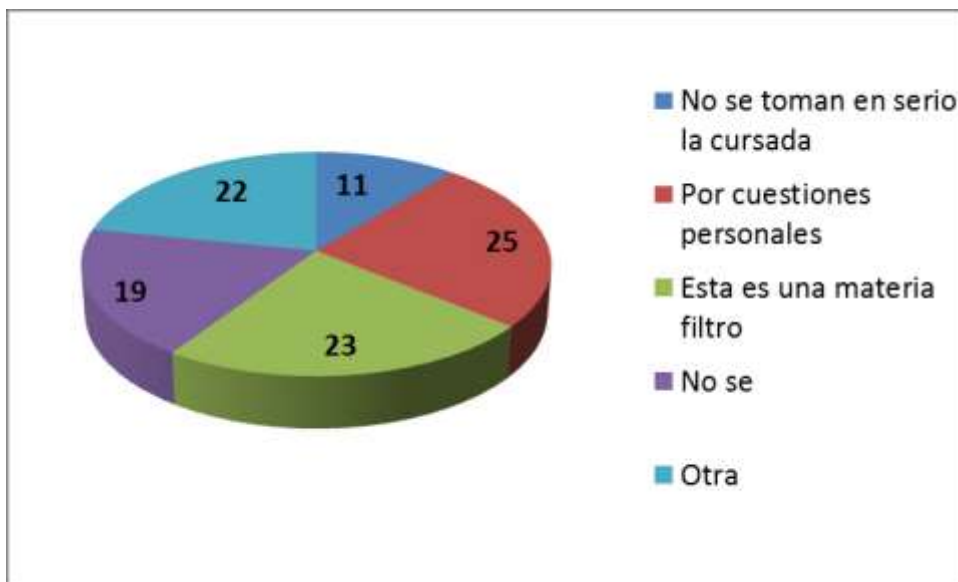
Figura 3. Evaluación del motivo de abandono de la cursada

El mismo día que se realizaron las encuestas se citó a los estudiantes para un primer encuentro en el marco del programa de tutorías. La convocatoria se difundió también por mail (a aquellos alumnos que en la encuesta dejaron asentado un interés por recibir información), Facebook y a través de los docentes. Algunos alumnos respondieron el correo avisando que estaban imposibilitados de asistir a la primera reunión, pero que deseaban mantenerse informados de las novedades que surgieran de la misma.