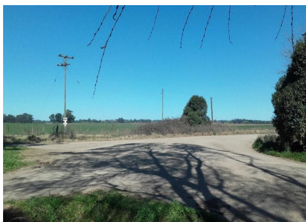
Fotos: Paraje El Coyunco 7 , 2016.