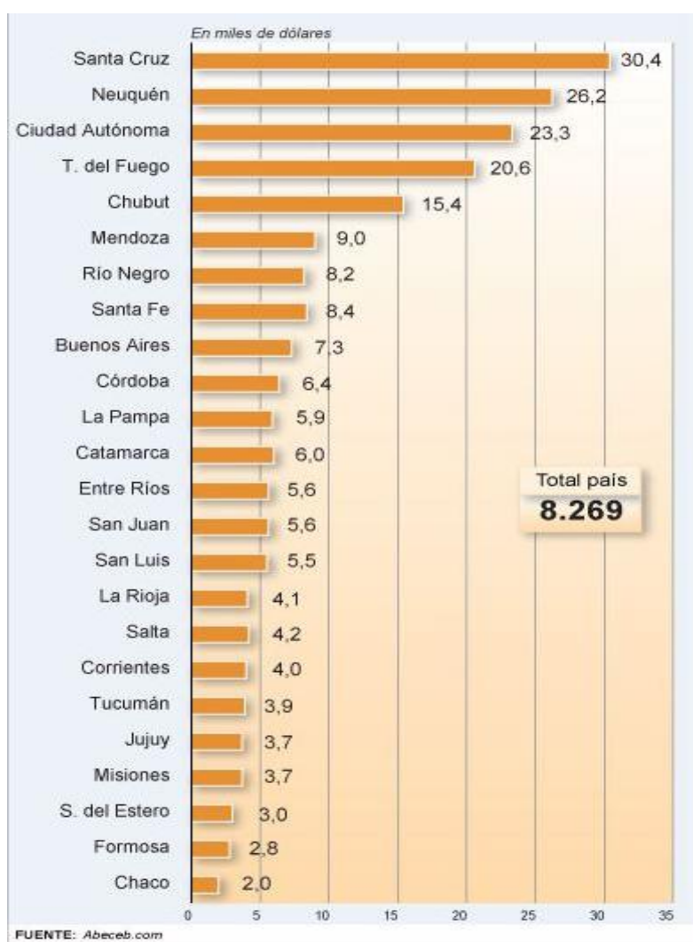
Figura 1: PGB per cápita a precios corrientes. Año 2008.

De la Figura 1 se desprende que las provincias con menor PGB per cápita corresponden en su gran mayoría a la región del NOA y el NEA. No disponemos actualmente de datos concretos sobre las redes migratorias al interior de las villas de emergencia y los asentamientos informales en la Ciudad de Buenos Aires, pero teniendo en cuenta las variables mencionadas podría ser éste uno de los factores que explicaría el crecimiento de la población villera en esta última década, si consideramos que gran parte de su población se compone de personas provenientes de la región del NOA y del NEA, así como de países limítrofes, aunque es posible también que muchas de ellas correspondan a segundas o terceras generaciones de migrantes.