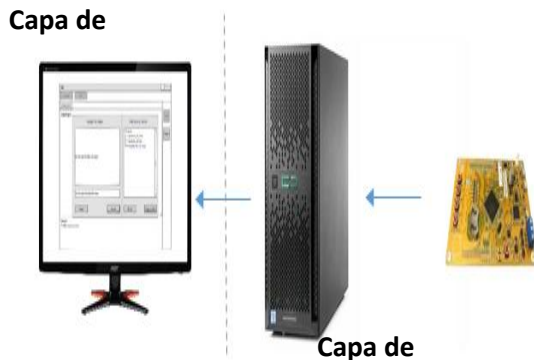
Fig. 1 Detalles de implementación del IDE

En este apartado, se realiza la presentación general del diseño de la solución. Posteriormente, se describirá la arquitectura del sistema sus componentes y cada una de sus capas. En cada capa, se definirán los componentes de hardware y software utilizados, y se establecerán las tareas realizadas y funcionalidad que cada componente. En la Fig. 1 se ilustra el detalle de la implementación, la cual está conformada por una capa de Hardware y una capa de Software.