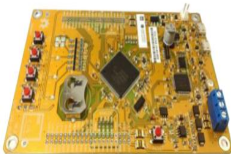
Fig. 2 EDU - CIAA - NXP

La capa de hardware se compone por una placa EDU-CIAA-NXP que es una versión de bajo costo de la CIAA-NXP pensada para la enseñanza universitaria, terciaria y secundaria (ver Figura 2).