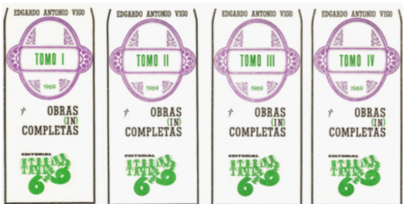
Figura 1. Edgardo A. Vigo, Obras (in) completas , 1969. Centro de Arte Experimental Vigo.

Entendemos que, sin asumirlo expresamente, Vigo ironiza sobre el mundo literario y del arte en general, y con ello, sobre un aspecto de la cultura que venía criticando desde hacía tiempo, como es la relación entre artista y espectador, y la propia entidad de la obra de arte, desvinculada de los cánones que la ubicaban en relación con las elites y alejada de la gente común.