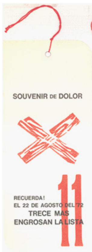
Figura 3. Edgardo A. Vigo, Señalamiento XI Souvenir del dolor, 1972. Centro de Arte Experimental Vigo.

En cuanto al titular del diario, el uso que realizó Vigo de la prensa –que ya tenía antecedentes en su propia obra, así como en la de otros artistas– se transforma, en este caso, en un elemento central que funciona como referencia contextual del tema de la obra. Al mismo tiempo, puede proponer una reflexión sobre el modo en que un medio de comunicación de masas informa la masacre de los guerrilleros.