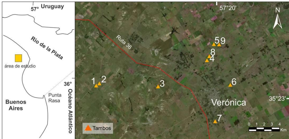
Figura 1. Ubicación del área de estudio y de los establecimientos tamberos monitoreados.

conductividad eléctrica (CE) y pH del agua subterránea con un equipo multiparamétrico portátil. En laboratorio se determinó el contenido de nitratos mediante método estandarizado (APHA 1998) en el Laboratorio de Geoquímica del Centro de Investigaciones Geológicas.