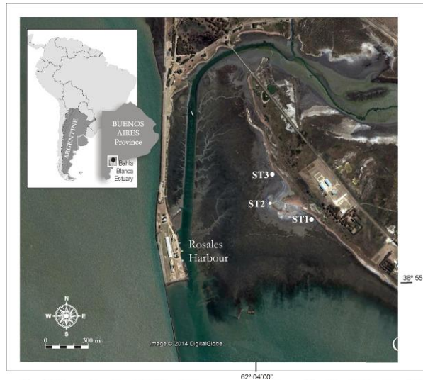
Figura 1: Estuario de Bahía Blanca y ubicación de Puerto Rosales. Se indican los tres sitios de muestreo ST1, ST2 y ST3.

la figura 3b se muestra la relación entre el \delta^{13}\text{C} y el \delta^{15}\text{N} para los tres sitios de estudio seleccionados y los valores reportados en la bibliográfica para las diferentes fuentes de MO.