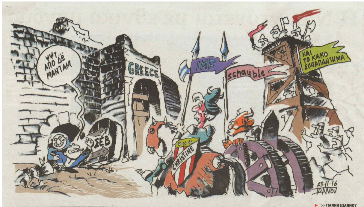
FIGURA 3 Christine Lagarde y el Dr. W. Sch#uble atacando el castillo griego