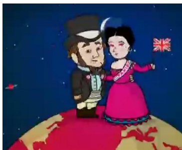
Figura 5 28