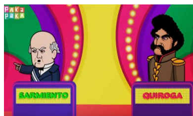
Figura 1 24