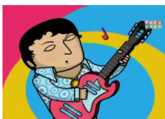
Figura 2 25