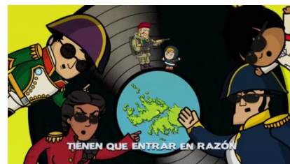
Figura 3 26