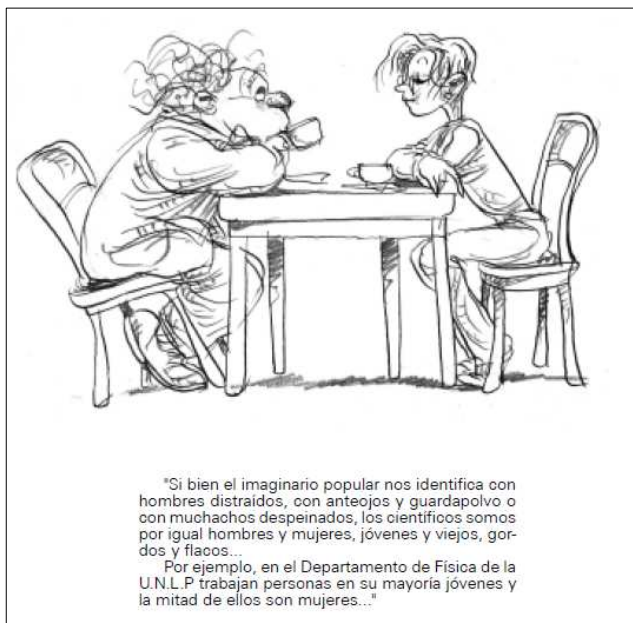
FIGURA 5. Ilustración de O'Kif, página 10 de Cero absoluto .

del libro). Además se agregó el comentario de que en el Departamento de Física trabajaban personas jóvenes (Figura 5).