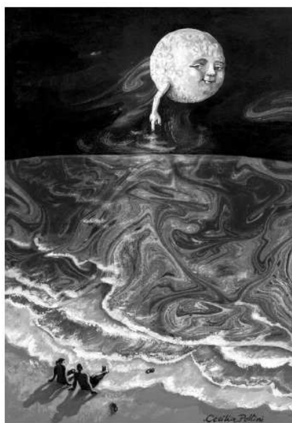
FIGURA 6. Ilustración de Cecilia Pollini, página 16 de Cero absoluto . En la versión original la Luna sujeta un imán con forma de herradura.

Por otra parte, la interpretación de los textos por parte de los artistas nos permitió detectar varias nociones alternativas en los ilustradores, que se manifestaban en sus producciones. Por ejemplo, en la ilustración original de la página 16 del libro la luna sería la responsable de las mareas debido a su magnetismo (Figura 6). A partir de esta experiencia, observamos que la producción de dibujos e ilustraciones de textos breves por parte de los estudiantes podría ser una herramienta interesante para la enseñanza.