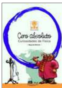
FIGURA 1. Portada de Cero Absoluto.