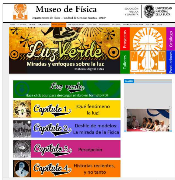
FIGURA 8. Material Digital del libro Luz verde .

En este libro, al igual que en el Cero absoluto , se incluyen apartados especiales de diversos colaboradores a fin de conseguir multiplicidad de miradas sobre el fenómeno, con la novedad de extender la propuesta más allá de lo disciplinar para abarcar aportes de la historia y del arte. Se incluye lo local a través de las menciones a escritores, músicos y poetas a lo largo de todo el libro, de una reseña sobre las particularidades de los defectos refractivos en nuestro país (capítulo 2), del análisis de artistas plásticos nacionales (capítulo 3) y de un panorama de las investigaciones sobre la luz en Argentina (capítulo 4). Como en el caso de Polo Sur , el material digital contiene propuestas de actividades concretas para el aula.