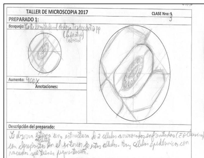
Figura 3. Tercer encuentro. Desgarrado de hoja

Esto es positivo dado que se mantuvieron las proporciones e indica que la síntesis inicial fue provechosa, pero no se percibe una complejización de las subestructuras: no hay un incremento del detalle. Sí se observa la división del plano en los cuadrantes con el eje vertical y el horizontal, así como la designación del punto central. En la figura 3 se ilustra el desgarrado de epidermis de una hoja vegetal en donde ya existe una complejización del bosquejo más pequeño, pero con información sintetizada, marcando la regularidad de las subestructuras, permitiendo inferir el entramado de las células.