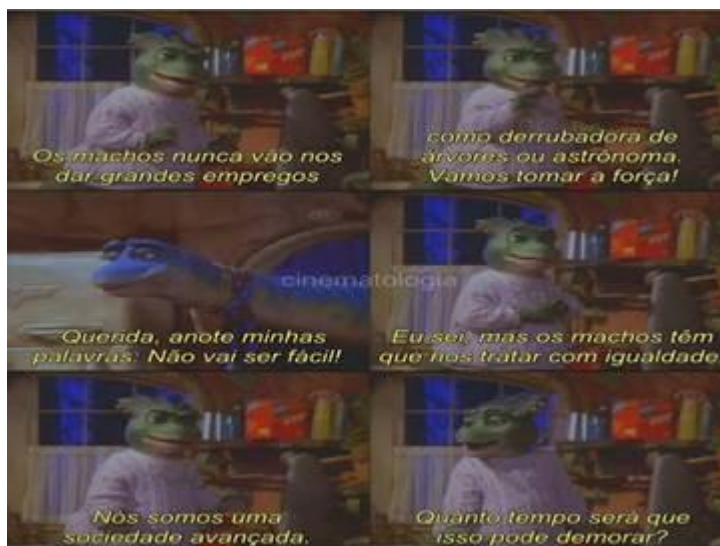
Figura 2: Crítica da série família dinossauros.

Este debate sobre a posição da mulher na sociedade foi discutido com os alunos também em cima da crítica da série: Família Dinossauros do ano de 1991 a 1994, (figura 2).