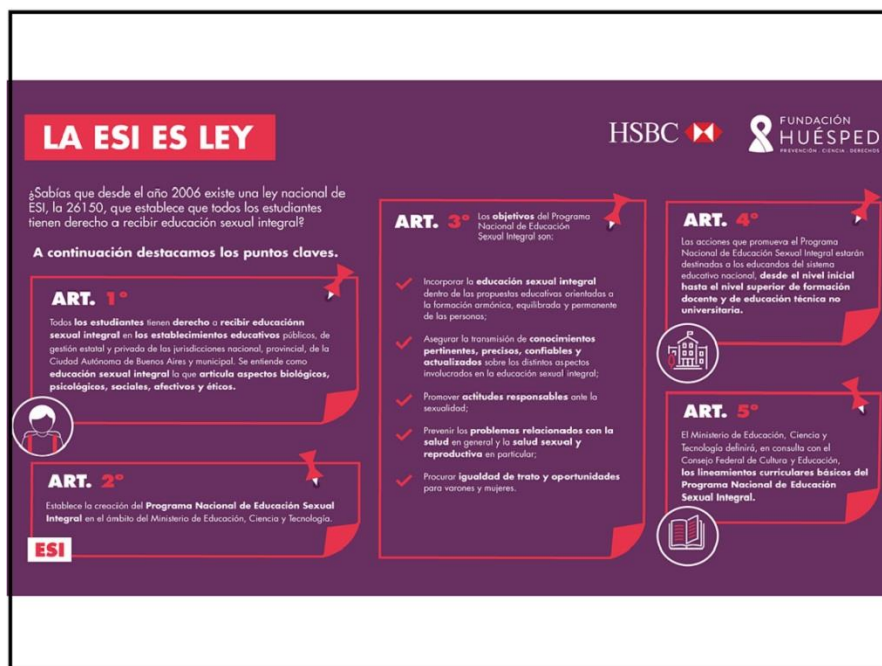
Figura 3. La ley y los núcleos de la ESI.

Se les propone a los estudiantes hacer una lectura en sus casas sobre la ley 26150 para socializar en la segunda actividad.