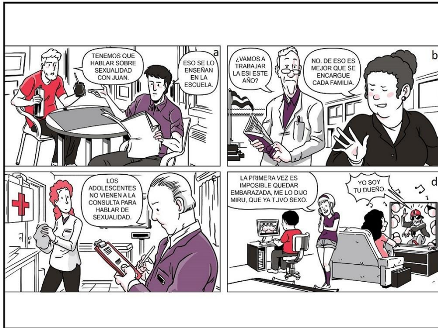
Figura 2. ¿Quiénes son los responsables? a: familia, b: escuela, c: salud, d: jóvenes.

En grupos mixtos de 5 alumnos les proponemos discutir y responder las siguientes cuestiones formuladas en un lenguaje simple y concreto: