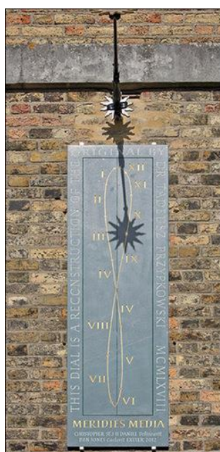
Figura 1. La curva analema dibujada sobre la superficie de un reloj de Sol vertical del Observatorio de Greenwich.

El Proyecto Analema (Camino et al., 2016) hace hincapié en la observación sistemática del Sol y promueve la discusión en torno a su enseñanza. Se sustenta en la construcción con materiales concretos de la analema, la curva que realiza el Sol en el cielo en el transcurso de un año si se lo observa desde un mismo lugar y a una hora civil fija. La resultante se debe al movimiento relativo entre el observador y el Sol, y en la Tierra tiene forma de “8” asimétrico. Posee una componente “vertical” que da cuenta de la variación en la declinación del Sol y una componente “horizontal” que muestra la diferencia entre la hora civil y el tiempo solar verdadero, como muestra la Figura 1.