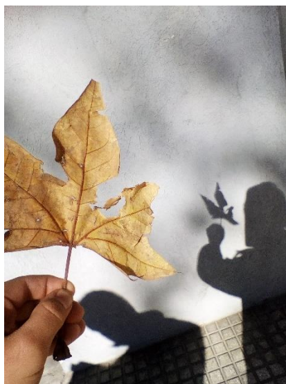
Figura 2. Fotografía tomada por un alumno para la Actividad A.

dentro de la secuencia, especialmente para desarrollar la capacidad de describir usando referencias. A partir de las fotografías, como la de la Figura 2, la actividad propuesta en clase consiste en descubrir el objeto (cuerpo) que produjo la sombra a partir de una proyección de la foto truncada, y describir las posiciones relativas del Sol, el objeto (cuerpo) y la sombra, de modo que expliciten que sus posiciones pueden unirse en línea recta y reparen en los tamaños relativos. Para ello los alumnos usan espontáneamente referencias de uso cotidiano como arriba , abajo , izquierda , derecha , adelante y atrás .