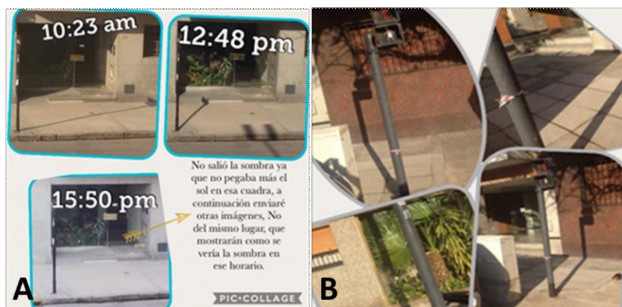
Figura 3: Fotografías y textos presentados por una alumna para la Actividad B. A: Fotografías del mismo lugar para tres horarios distintos de un día. B: Fotografías que la alumna toma en otro lugar para igual horario vespertino a los efectos de mostrar sombras.

sus fotografías, como las de la Figura 3, los alumnos constatarán que las sombras más cortas se asocian con un horario cercano al mediodía, cuando la altura del Sol es relativamente grande.