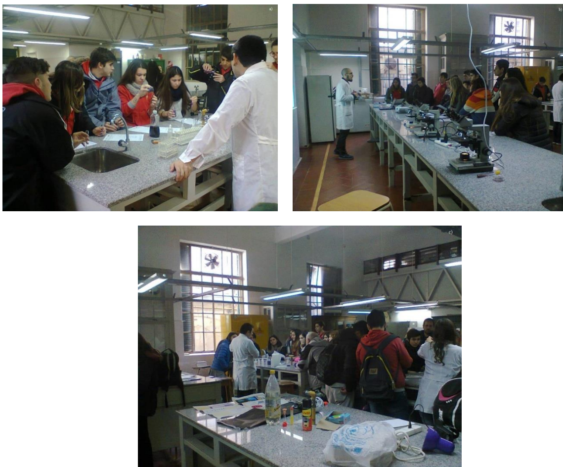
Figura 1: fotografías a) b) y c): Actividades experimentales en laboratorios de la facultad

Luego se realizan las actividades planeadas, en el espacio de la Biblioteca-Museo y en laboratorios de la Facultad, lo cual permite a los alumnos familiarizarse e integrarse mejor a estos ámbitos (Huerta, 2010). Los temas abordados son acordados con los docentes, de manera que se relacionen con los conocimientos previos de los alumnos, al mismo tiempo que se busca que sean interesantes y novedosos. Se realiza una charla explicativa con un enfoque histórico de los conceptos y su avance en el tiempo, con un dinamismo de preguntas e intercambio de diálogo con los alumnos, permitiéndoles participar desde su curiosidad por el tema. Luego se procede a una actividad práctica, en la cual se realizan observaciones microscópicas y experimentos simples empleando materiales de uso cotidiano y fácil acceso, con el objetivo de evidenciar la presencia de estas ciencias en nuestro día a día; permitiendo así fijar y relacionar los conceptos mediante una participación activa (Figura 1).