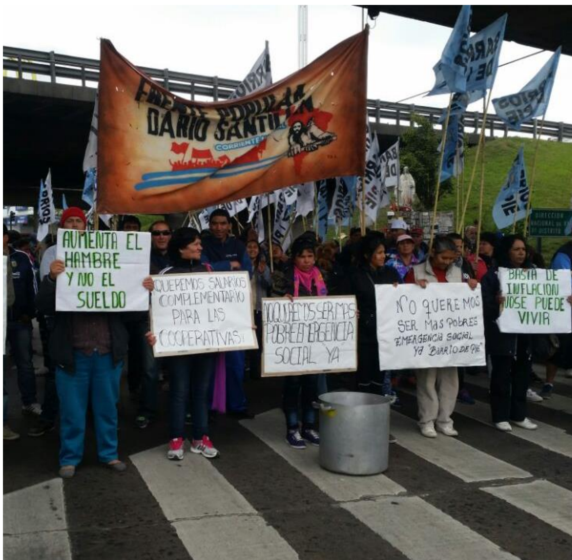
Marcha contra el hambre en la Avda. Gral. Paz, 2016. Archivo personal.

popular estamos presionando más, significa que nos quedamos y también que el pueblo tiene hambre” 146 . Esta politización del “hambre” y de la supervivencia por parte de los movimientos piqueteros, como han señalado otros trabajos (Voria, 2012), pone a las mujeres en un nuevo lugar público, porque las necesidades que son su trabajo y preocupación fundamental salen para siempre del ámbito del hogar.