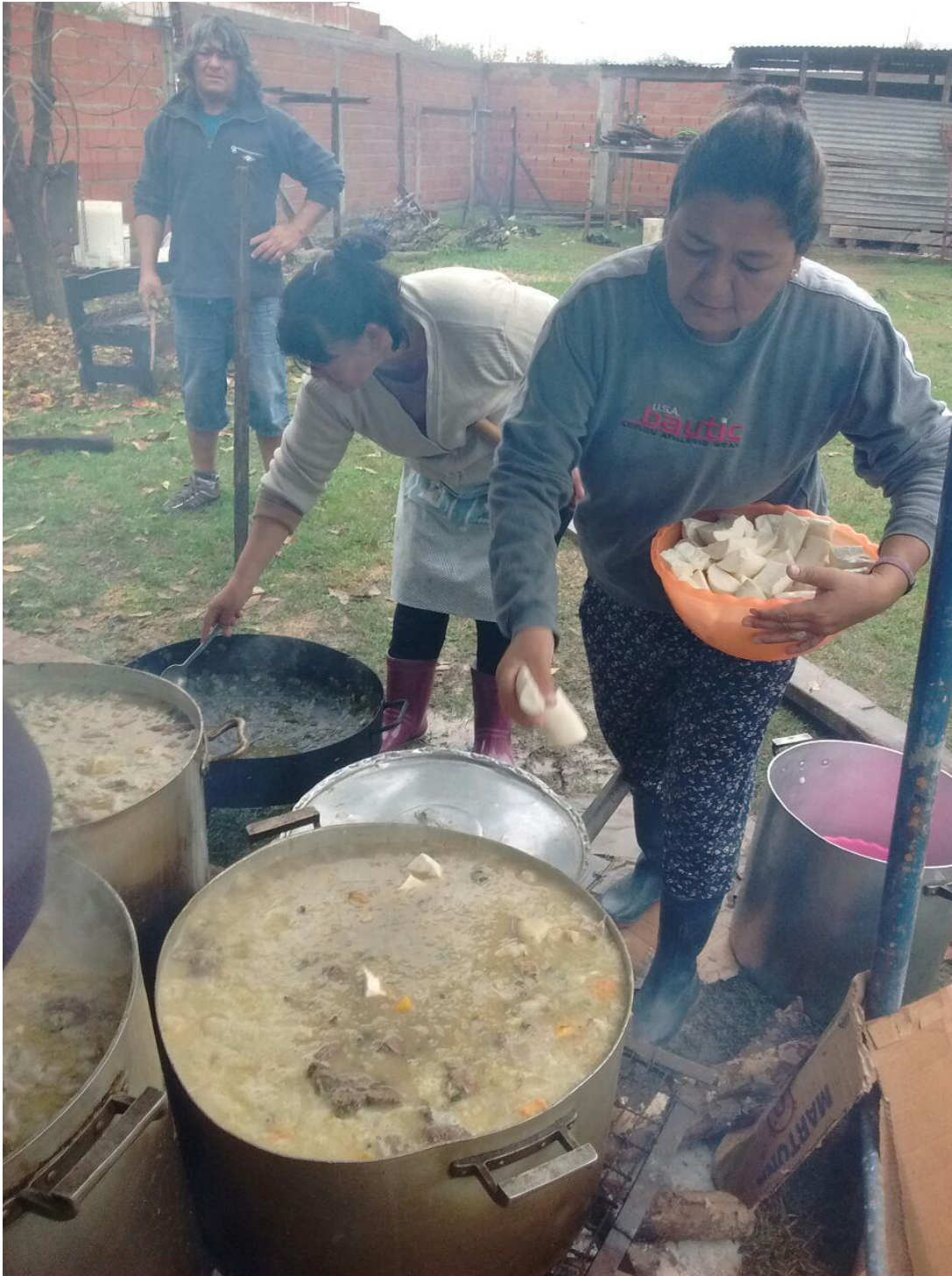
Comedor “Los Amigos”, 2016.

Al salir de “Los Amigos” con Luz miramos de frente a la empresa más importante de Villa Argüello y actualmente, de Berisso. A esta altura del recorrido, es patente el cambio atmosférico que produce la destilería de YPF, que en 64 y 131, se encuentra a menos de