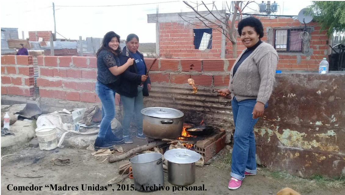
Comedor “Madres Unidas”, 2015. Archivo personal.

En poco tiempo, las actividades de cocinar colectivamente para las familias se ampliaron hasta generar emprendimientos de trabajo y mejoras barriales. Resulta significativo que estas prácticas de cooperación y construcción colectiva trascienden la edificación de viviendas personales y familiares para pensar el hábitat general en el barrio. “En Villa Argüello hicimos las veredas, compramos la tierra para rellenar las calles, hicimos las zanjas”, afirma Rosa. Estas estrategias de autogestión se combinan de maneras diversas con las gestiones y movilizaciones de exigencia al estado municipal. “Con la organización fuimos al municipio a reclamar arreglos en todos los barrios, pedimos tierra para rellenar, y también certificados de posesión de los terrenos en los que estamos. El problema principal que le planteamos al intendente es el de la Autopista, que es una amenaza permanente”, afirma Amira. Con esto se refiere a que la construcción de esta vía implicaría el desalojo y demolición de todo el asentamiento.