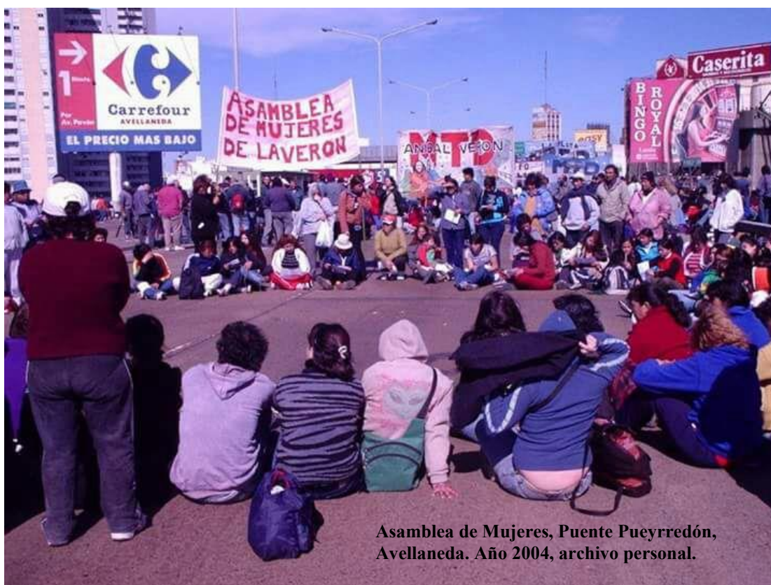
Asamblea de Mujeres, Puente Pueyrredón, Avellaneda. Año 2004, archivo personal.

Pero este 26 de octubre de 2003, algo importante va a suceder. Un volante circula de mano en mano: “¿Hablás en las asambleas? ¿Decidiste sobre tu maternidad? ¿Sabes cómo cuidarte? ¿Representas a tu movimiento fuera del barrio? A las 13 hs. Asamblea de Mujeres delante del Piquete”. El papel es recibido de diferentes maneras, con interés o duda, pero también con risas o sarcasmos. Algunos varones hacen chistes o se enojan porque dicen que “estas cosas dividen la lucha” o “acá venimos a reclamar por nuestros compañeros, esto ¿qué tiene que ver?”.