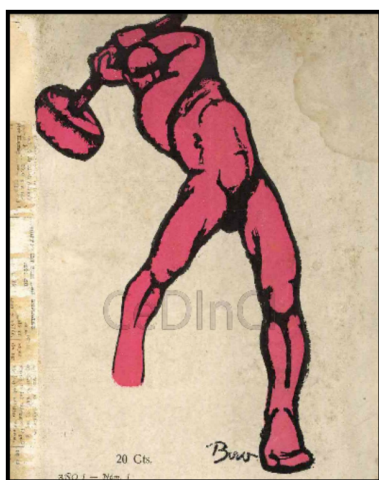
Portada Revista de Oriente n° 4, 1925.