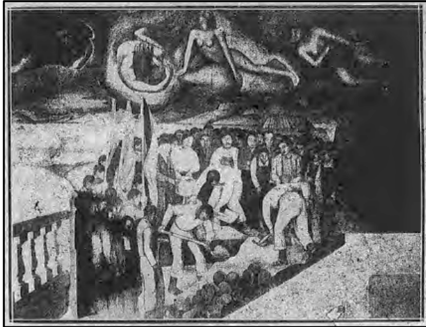
“La lluvia fecundante”, funerales de víctimas proletarias. Revista de Oriente , n° 9-10, 1926.

En ese sentido, la entrevista a Rogelio Yrurtia (1879-1950) que recupera la revista también puede ser leída bajo la clave del constructivismo. En ella se reconoce una escultura de bronce llamada “El Canto al trabajo” 40 que representa la idea de que el trabajo, y por ende las condiciones en que se trabaja, pueden ser llevados a cabo o bien como una actividad creativa o bien como una carga. En efecto, el arte tiene otra vez un contenido político y una potencialidad transformadora. Yrurtia, dice la revista, “ presenta a sus figuras en forma natural, con actitudes lógicas y no impostadas, encontrando allí un modo de representar el ritmo suave de las formas y los músculos ”. 41