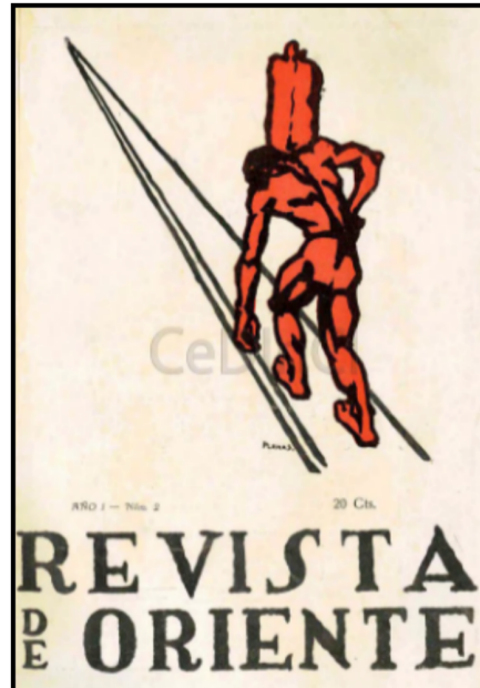
Portada Revista de Oriente n° 2, julio 1925.

Como puede observarse, los obreros que ilustra la Revista de Oriente no tienen rostro ni nacionalidad, cuestión que atiende al énfasis internacionalista hallado a lo largo de todos los números. Sumado a esto, el color predominante es sin dudas el rojo, lo que indica otro punto en común con las obras canónicas del constructivismo, tales como los trabajos de Kasimir Malévich o Aleksandr Ródchenko, artistas que pensaban al arte al servicio de la revolución bolchevique. Éste quizás sea el ejemplo más claro del efecto que puede tener la propaganda social y política sobre las representaciones colectivas. Nuevamente, la interpretación de la experiencia rusa deja marcas y ansias de erradicar las relaciones de explotación capitalistas.