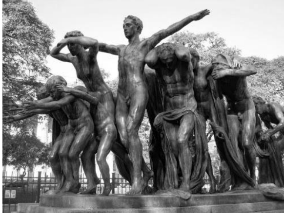
“Canto al trabajo”, obra cumbre de Rogelio Yrurtia.