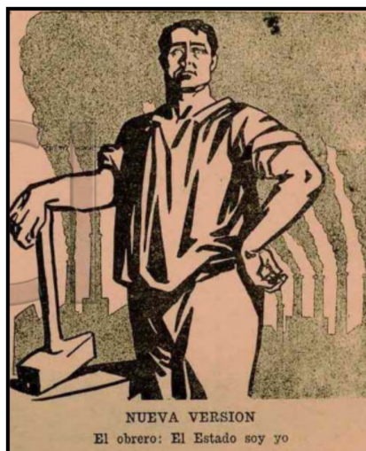
«Nueva versión. El obrero: “el Estado soy yo”», Revista de Oriente , n°1, 1925.

Adicionalmente, en 1920 se conformó el “Programa de grupo productivista”, ideado por Vladímir Tatlin, Aleksandr Rodchenko y Varvara Stepanova. Proclamaban un constructivismo como “expresión comunista de una obra materialista constructiva”, basándose en el comunismo científico, es decir, en las hipótesis del materialismo histórico. 39 Sus objetivos, dicho de manera sucinta, eran: participar de la producción intelectual y artística revolucionaria, edificar una cultura comunista, y obtener contacto con los centros productivos y con los organismos centrales de los soviets. Una de sus premisas elementales era desplazar sus actividades de investigación de lo abstracto a lo real; el artista debía encontrar anclaje en la vida práctica, en un mundo condicionado por necesidades materiales de existencia. Conociendo estos elementos, los aportes de la historia del arte pueden sugerirnos posibles lecturas de la Revista de Oriente . Es evidente, por ejemplo, que lo real —en oposición a lo abstracto— tiene un lugar privilegiado en las imágenes y pinturas seleccionadas en cualquiera de las publicaciones. Pensar un sujeto nuevo en una realidad también emergente implicaba ir más allá del adorno estético y la mera representación. Es el caso de la siguiente pintura, donde se ve, nuevamente, el lado oscuro del mundo del trabajo.