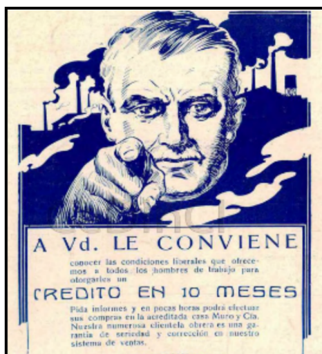
Publicidad de créditos para “hombres de trabajo” (1925), Revista de Oriente , número 4, p.36.

En lo que respecta a características de la revista como dispositivo gráfico, la misma contaba con una gran calidad de producción: tiraje de 20.000 ejemplares 16 , distribución de contenido en seis secciones (informativa, ensayos, carta, literaria, bibliográfica y crónicas), distribución y recepción en Buenos Aires, Córdoba y Santa Fe. Es notable el interés constante que mostraba en expandir el área de circulación y en ganar agentes de diferentes localidades de Buenos Aires y el interior; 17 esto puede visualizarse en algunos avisos en donde solicitaban el nombre de personas a quienes ofrecerle la agencia, que viviesen en localidades como Ayacucho, Campana, Junín, Salta, La Rioja, o San Juan. Tales pedidos ponían el acento en reflejar la vida obrera y campesina. Así, un aviso decía: “[...] Camarada, campesino, infórmenos sobre las condiciones de vida en el lugar en que usted trabaja ”. 18 Incluso en las zonas publicitarias puede rastreadse a qué sujetos les habla la Revista de Oriente . Anuncios que aparecen de manera recurrente son los de marcas de cigarrillos, cerveza Quilmes, aperitivo Vermut, caramelos Mu-Mú o el llamativo cartel de una sociedad financiera que ofrece “créditos en 10 meses para los hombres de trabajo” 19 . Asimismo, una sección denominada “Profesionales” publicaba direcciones de diferentes trabajadores tales como médicos, abogados, dentistas, constructores.