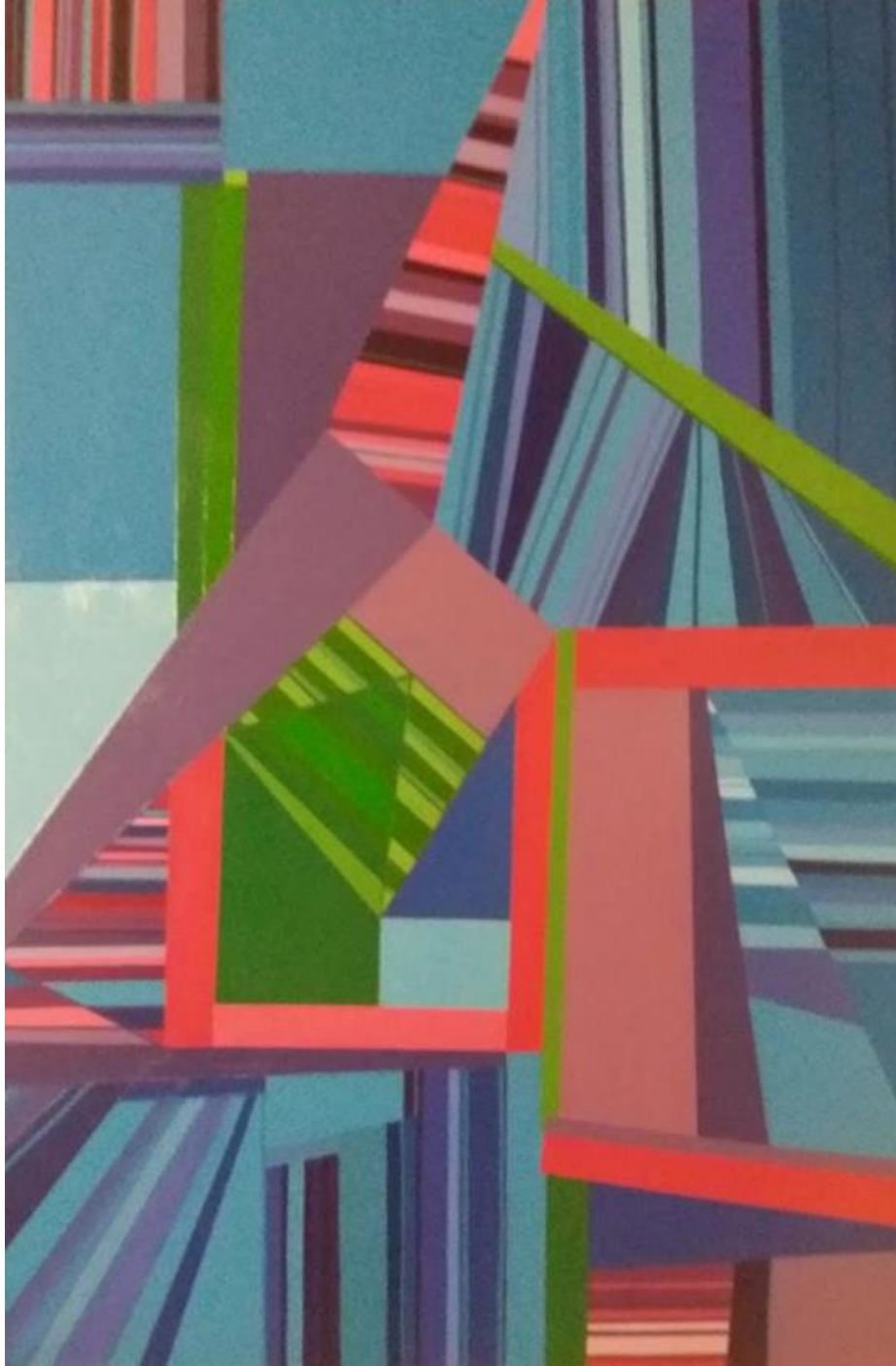
BG 1008 (2018) Acrílico sobre bastidor de 0,60 X 0,90 cm.