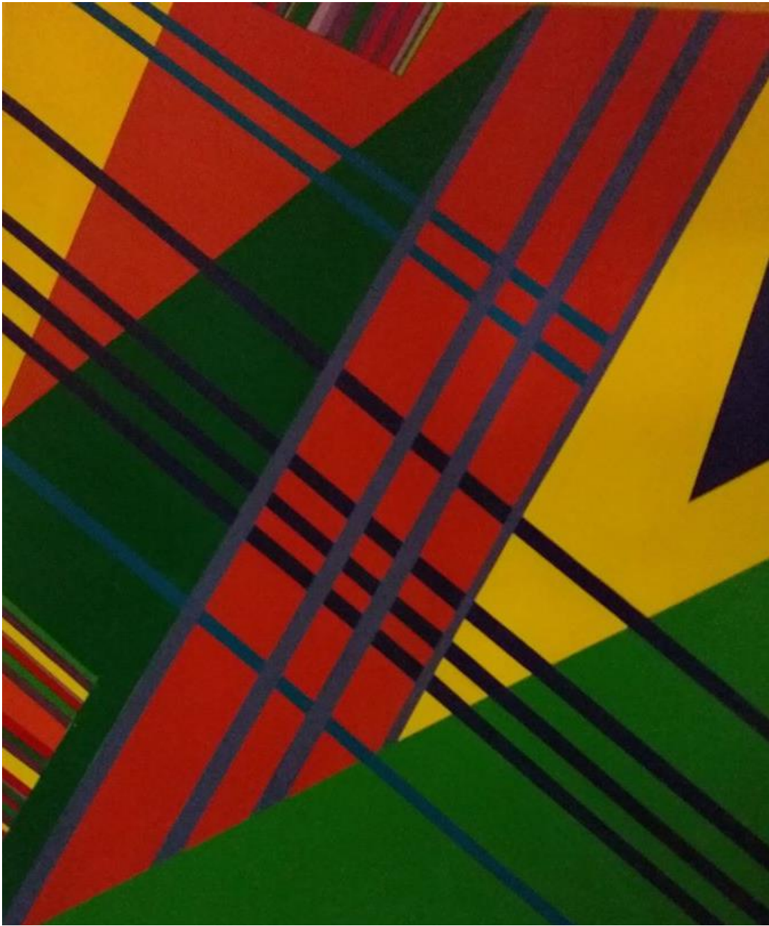
EG 3011 (2018) Acrílico sobre bastidor de 1 X 1,20 m.