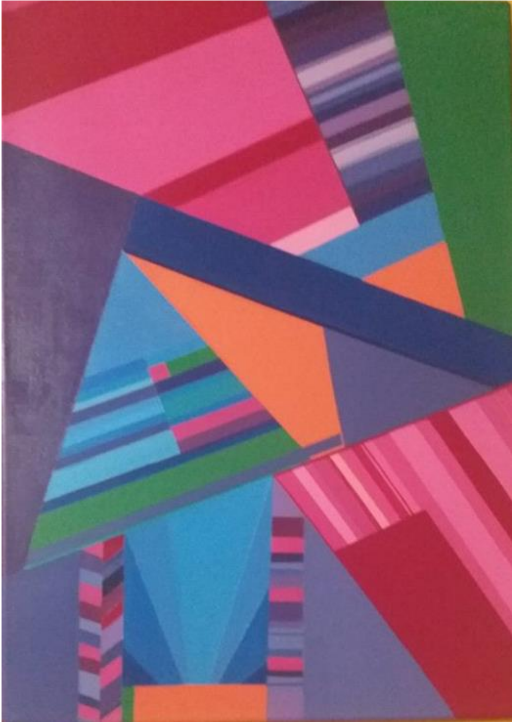
BG 1005 (2018) Acrílico sobre bastidor de 0,50 x 0,70 cm.