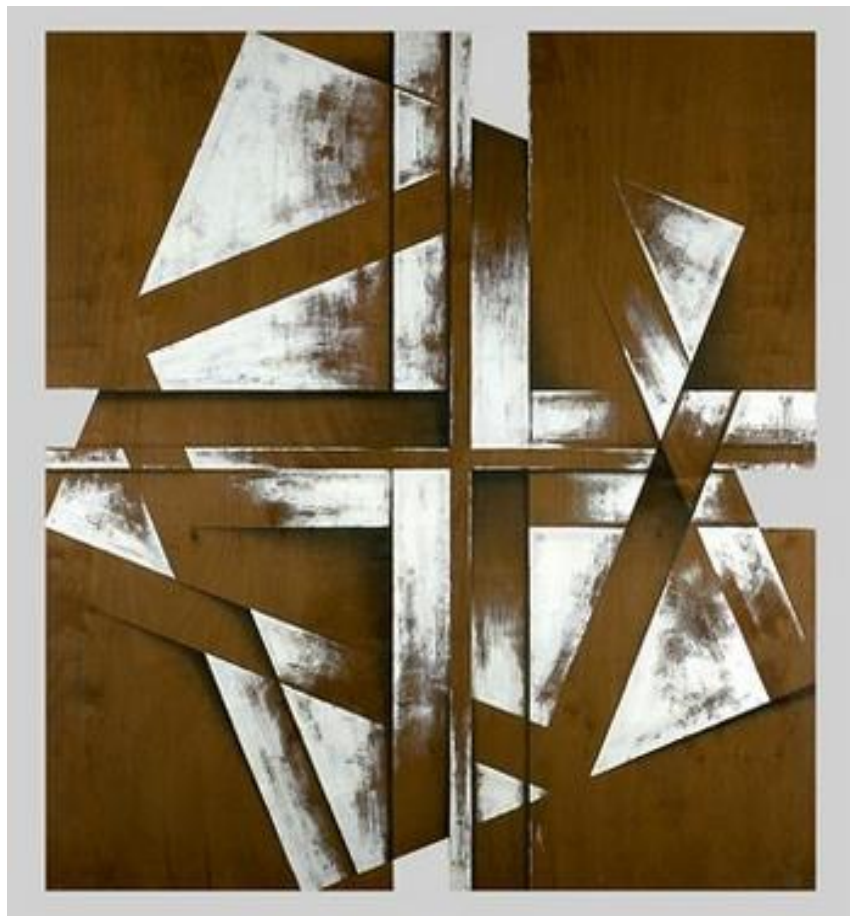
"Pintura bi- espacial" (1996)

De este artista, resulta interesante su manera de componer y la diversidad de materiales que utiliza para producir sus obras.