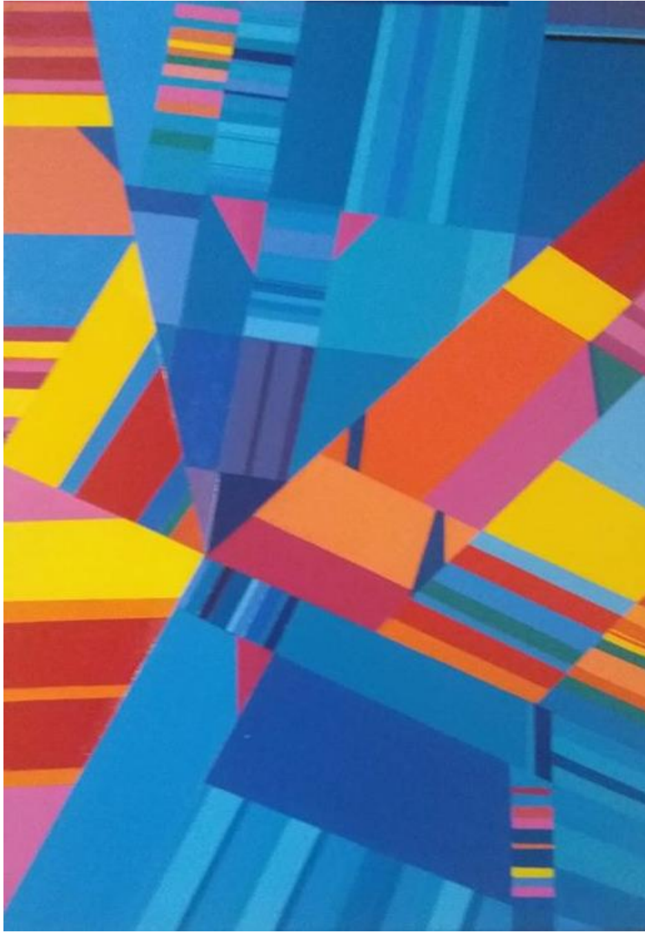
BG 1003 (2017) Acrílico sobre bastidor de 50 X 70 cm.