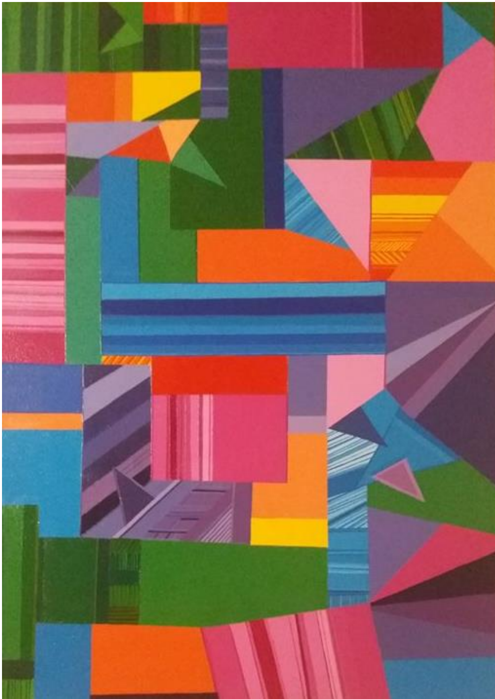
AG 1002 (2016) Acrílico sobre bastidor de 50 X 70 cm.