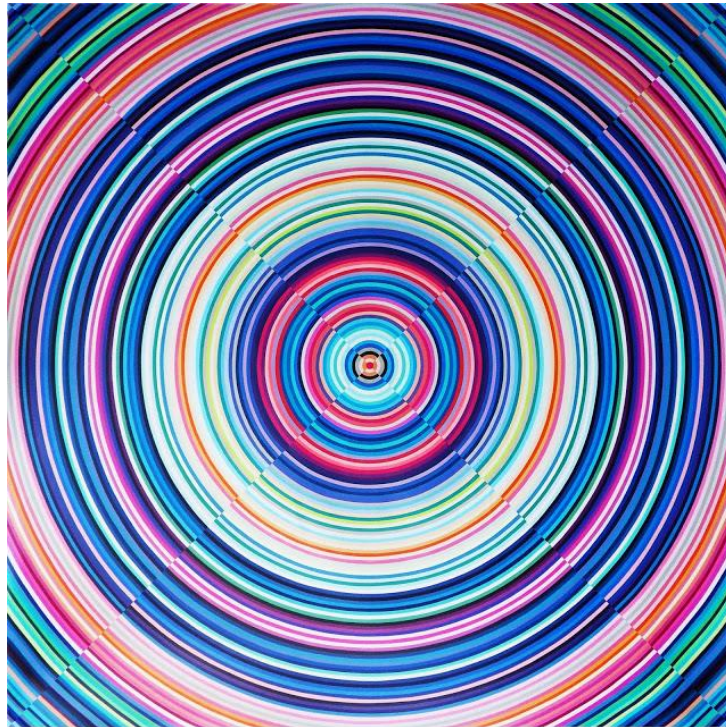
"Disco 4" (2013)

Nació en 1971. Es Licenciada y Profesora de Artes Plásticas egresada de la Facultad de Bellas Artes de la UNLP. También se dedica a la conservación y restauración. Asiste en 2011 al taller de Sergio Bazán y Manuel Amestoy y durante el 2012, al de Tulio de Sagastizabal. Mi interés por su obra reside en el acabado de su técnica, y la utilización de una amplia paleta de color.