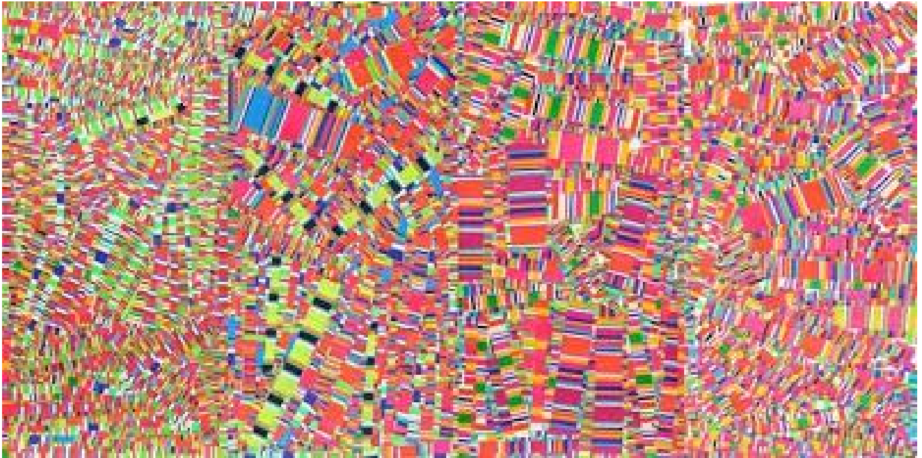
“Freaking con fluo” (2010)

Nació en Buenos Aires en 1941. Su obra se encuadra dentro de las tendencias informalistas y es de una notable originalidad. Posee un carácter conceptual, pop, psicodélico y de acción. Durante fines de los años sesenta, Minujín adhiere al movimiento contracultural hippie en Nueva York, donde se vuelca al arte pop y el arte psicodélico. Dentro de su extensa producción de obra, sus collages resultan no sólo impactantes a nivel visual, sino que además el trabajo de esta tesis comenzó a partir de la utilización de dichas imágenes como disparadores visuales al momento de realizar la propia obra, en el segundo año de la básica de la carrera.