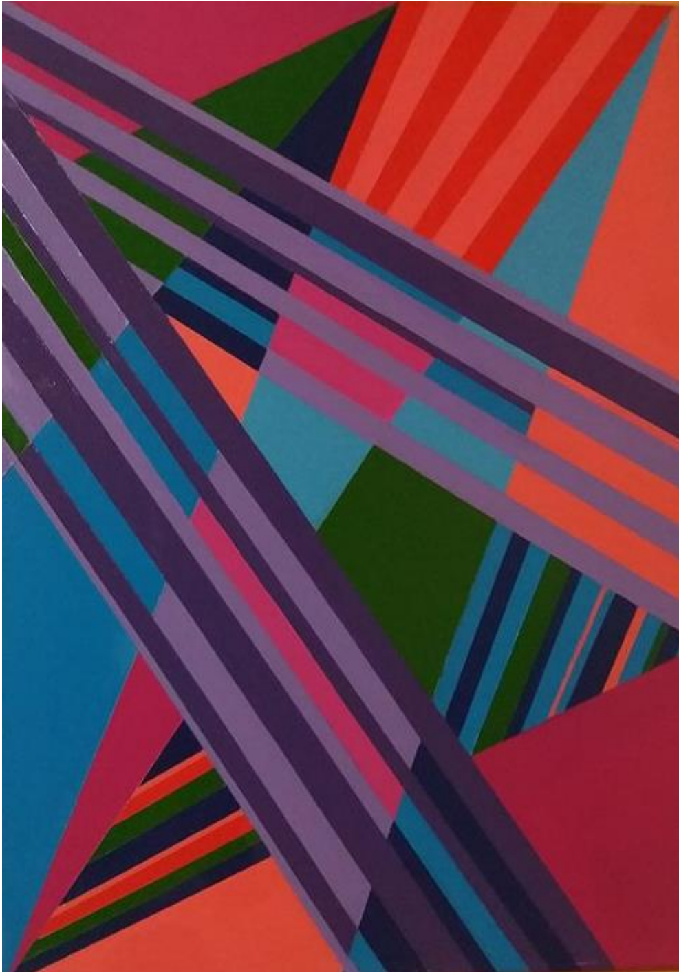
BG 1007 (2018) Acrílico sobre bastidor de 0,50 X 0,70 cm.