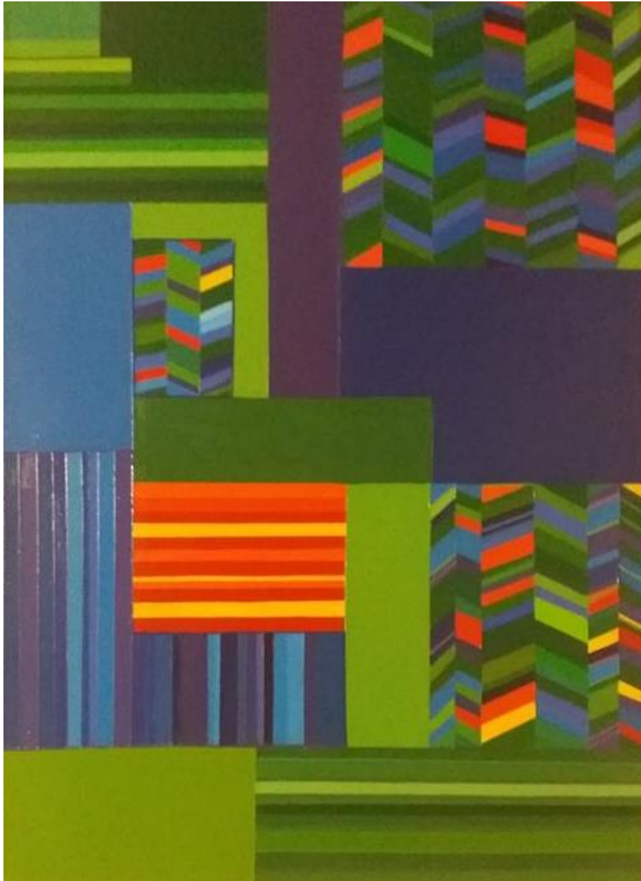
CG 1004 (2017) Acrílico sobre bastidor de 50 X 70 cm.