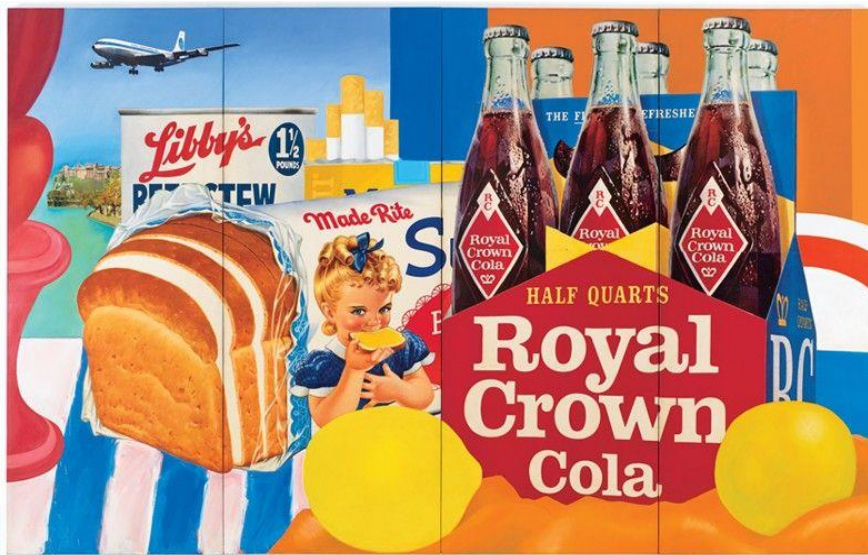
"Naturaleza muerta n°35" (1963)

De este artista, resulta de especial interés, sus variadas paletas, en las que utiliza colores generativos, las cuales fueron tomadas para la realización de las diversas obras que constituyen el presente trabajo de investigación.