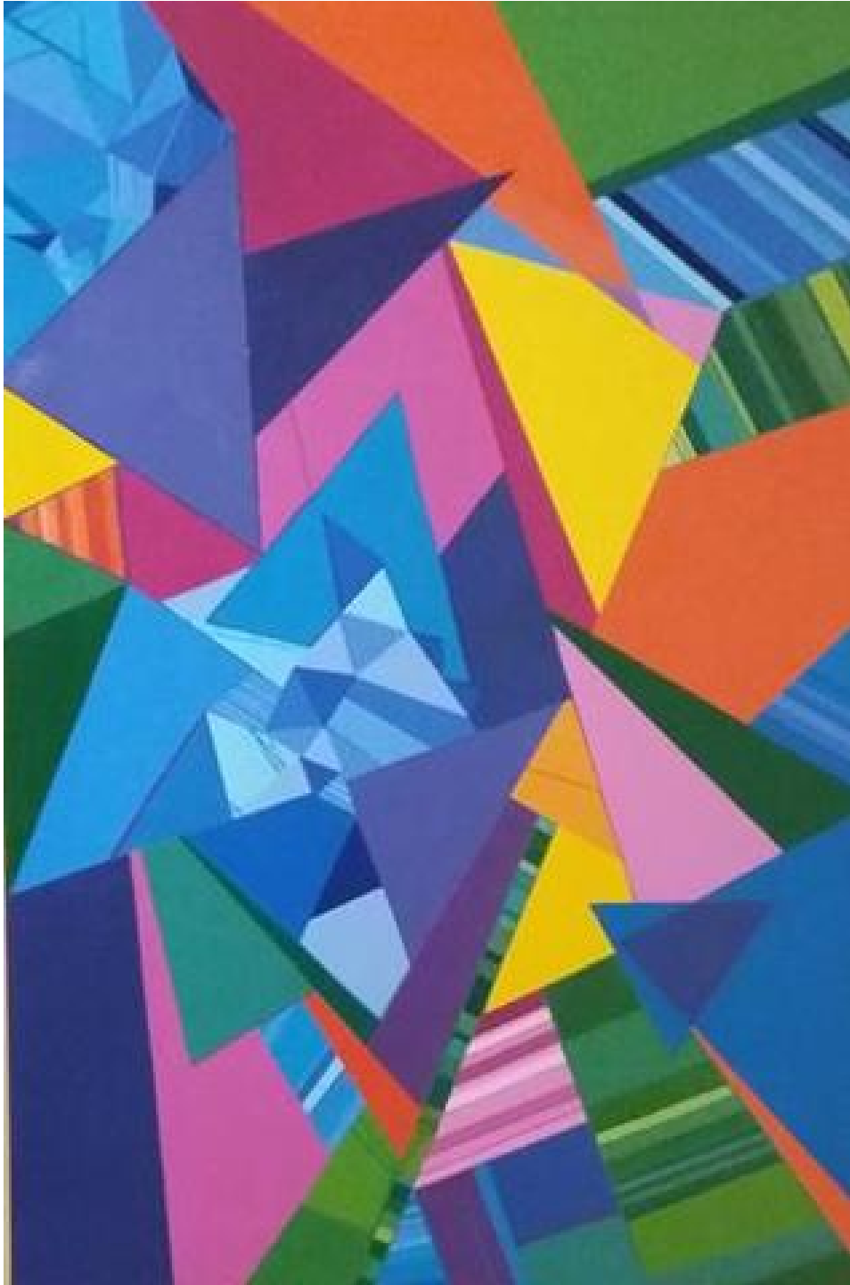
AG 1009 (2018) Acrílico sobre bastidor de 0,80 X 1,20 cm.