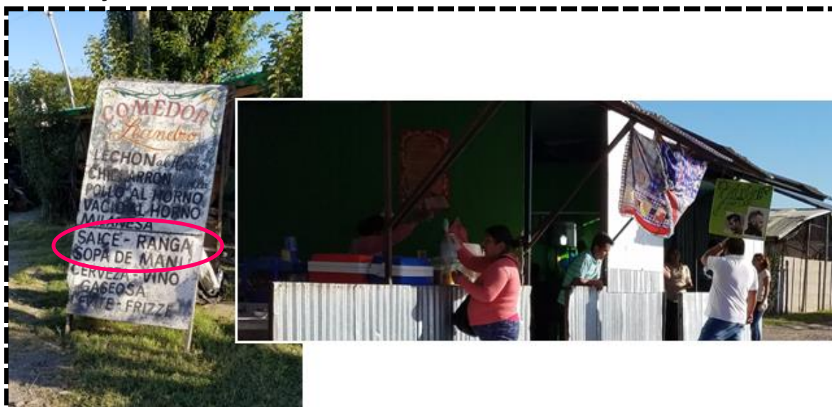
Fuente: Elaboración propia, Febrero de 2017, Abasto, Partido de La Plata