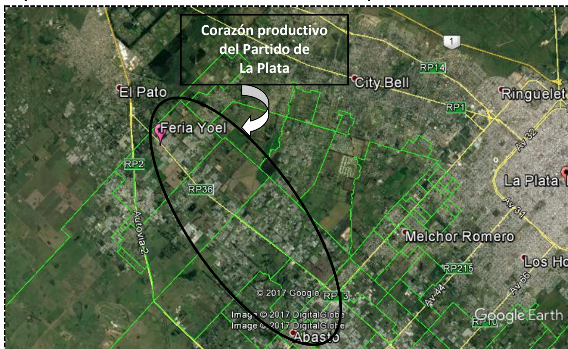
Mapa n°1: Ubicación de la feria Yoel en el Periurbano platense

Elaboración Propia sobre la Base de imagen digital globe, 28 de julio 2017