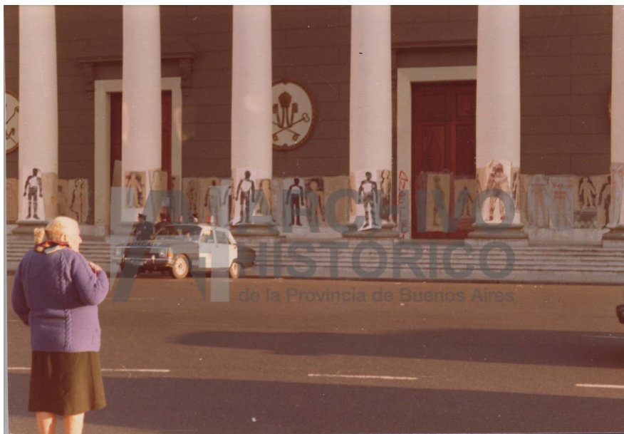
22 o 21 de septiembre de 1983 Tercera Marcha de la Resistencia. Siluetazo. Buchona. [En catálogo de Memoria Abierta figura: La mujer que se ve en la foto está marcada en el reverso como "Buchona". Era una española infiltrada entre las Madres] (S.9: 18)