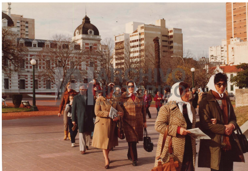
1/7/1981. Entrega Petitorio al gobierno provincial, Plaza San Martín. (S.9: 85)