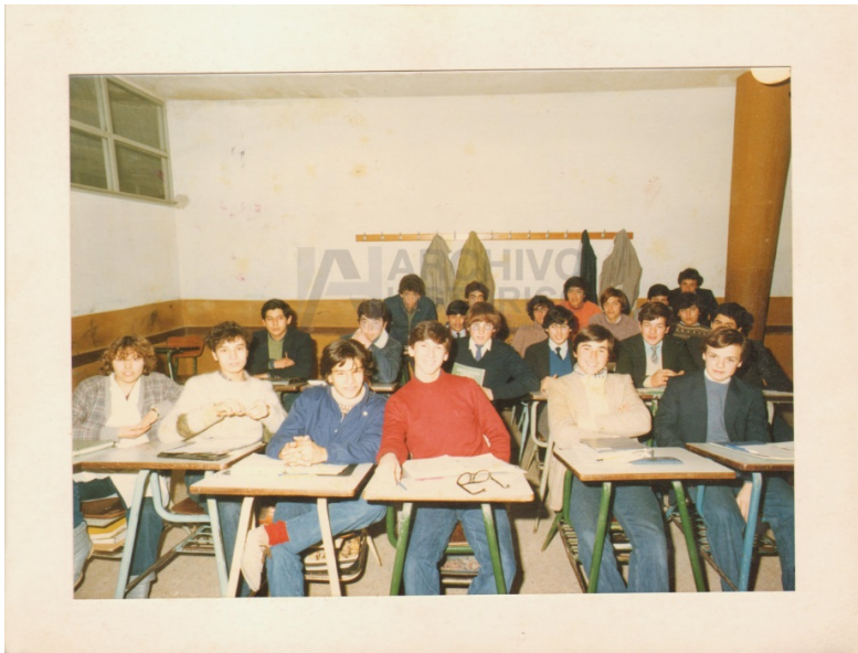
Escuela Técnica de La Plata. 1977 (S.9: 1393)