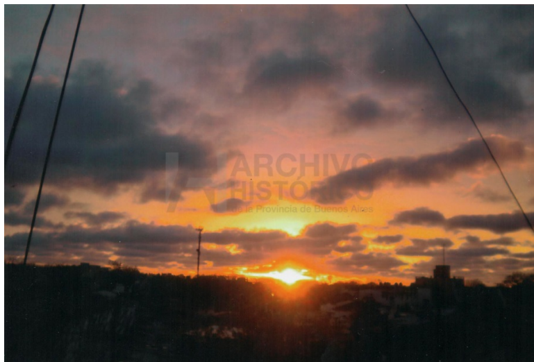
Desde la ventana 6.20 hs. Lunes 2/10/2011 ¡El sol sale para todos! (S.9: 3641)