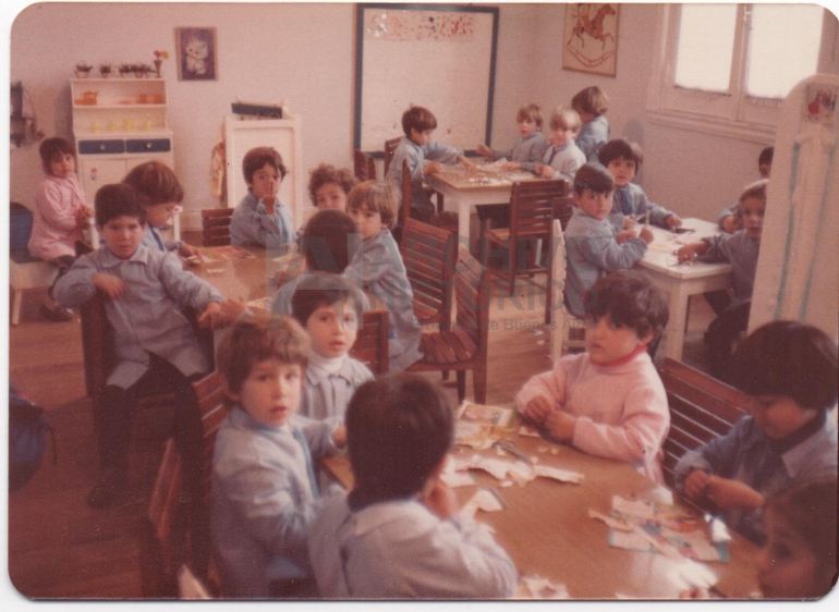
Jardín de infantes N°1 Azul Tercera Sección (1979) (S.9: 1400)