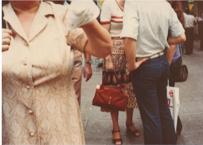
10/09/1980 Madres reparten volantes en calle Florida. En catálogo de Memoria abierta figura “La sincabeza es Rosario...” (S.9.4:27)

de las fotos tienen ese encuadre, o están movidas, por lo que podrían ser criticadas desde un punto de vista técnico, sin embargo reponen en su forma estética el contexto en el cual se produjeron.