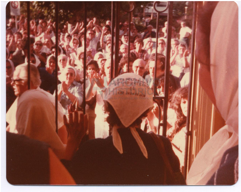
Ayuno en Quilmes, salida 22/12/81 (S.9:107)

A medida que avance el tiempo las fotografías irán mostrando cambios en esas mujeres que irán incorporando distintivos y otros elementos. Además de los pañuelos