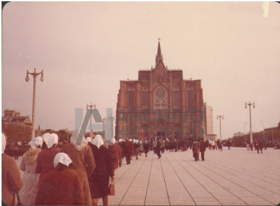
15 o 16 de junio de 1980. Procesión Corpus Christi, Catedral La Plata. [Procesión de corpus, La Plata, 16/6/80. Las que llevaban pañuelo en el brazo eran por otras flias.] (S.9.3: 1421 )