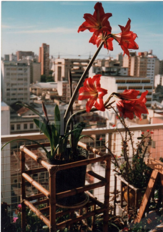
Jardín Casa de Adelina (casa calle 27...) (S.9: 3678)

La tercera serie podríamos denominarla Adelina y otras búsquedas estéticas. En el archivo la mayoría de estas fotos se encuentran contenidas en una carpeta denominada “Adelina fotógrafa”. En ellas podemos ver que Adelina compone imágenes, pareciera que con otra intencionalidad y sentido estético. Muchas de ellas son fotos de paisajes, donde predominan elementos de la naturaleza, sobre todo árboles y flores.