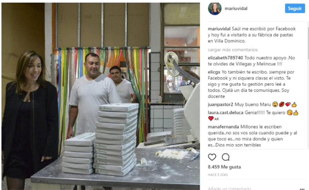
Imagen 2: Publicación de María Eugenia Vidal en Instagram 12/05/2017

Los llamados son la tercera forma en la que aparece el ciudadano en los contenidos compartidos por ambos dirigentes. El hecho de que el presidente o la gobernadora llamen a la casa de algún ciudadano contribuye a crear la imagen de un contacto directo y apela a la