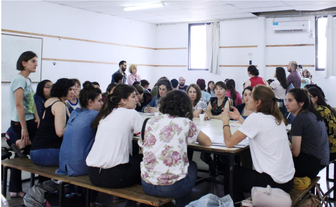
Mesas de trabajo. Reflexiones y debates entre docentes y alumnos.