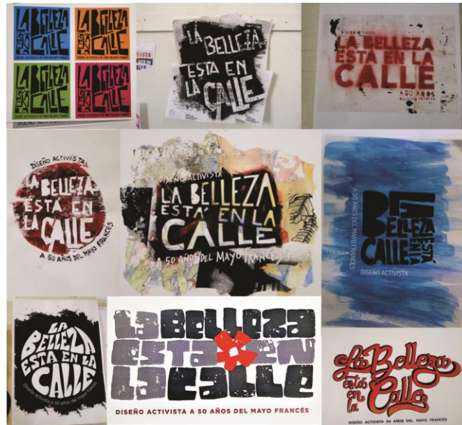
Concurso interno de marca para la jornada “La belleza está en la calle”. Taller 2

Todos los años proponemos una visita guiada que contextualice algún trabajo específico, que amplíe la mirada sobre el tema particular. El año pasado visitamos "35 años del siluetazo" en el Museo de Arte y Memoria de La Plata: una manera de conectar las prácticas artísticas del '68 con otras formas del diseño activista en distintos momentos de la historia, y desde la historia argentina.