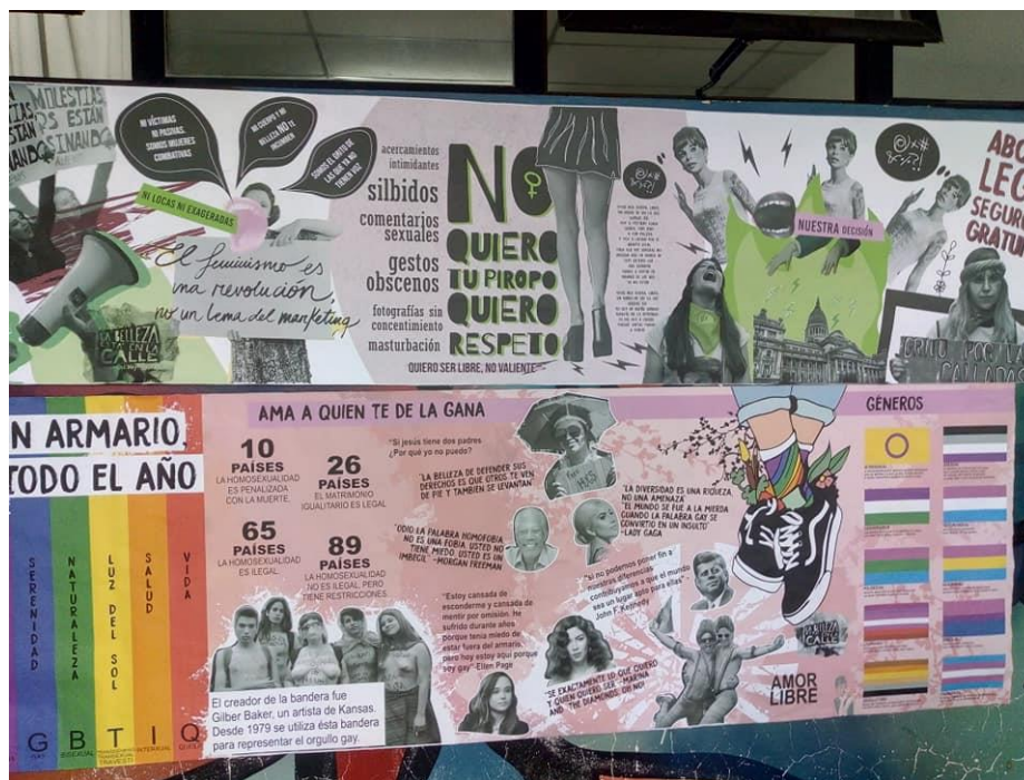
Montaje de los diarios murales. Intervención en la Sede Fonseca de FBA. Taller 3 La belleza está en la calle: la jornada

El proceso implicó la combinación de diferentes técnicas: impresión de textos para garantizar su legibilidad y, en un proceso posterior, el agregado artesanal de todas las imágenes, interviniendo las impresiones (fotomontajes, ilustraciones, stencil, salpicados de pinturas, entre otros). Como resultado, se fusionó la estructura tradicional de un diario y la gestualidad y el universo expresivo del arte callejero.