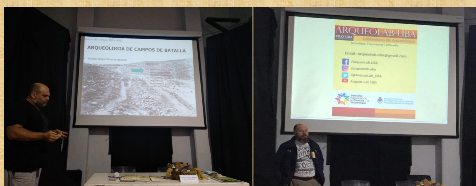
Charlas para la comunidad en el Centro Cultural y Museo Usina Vieja