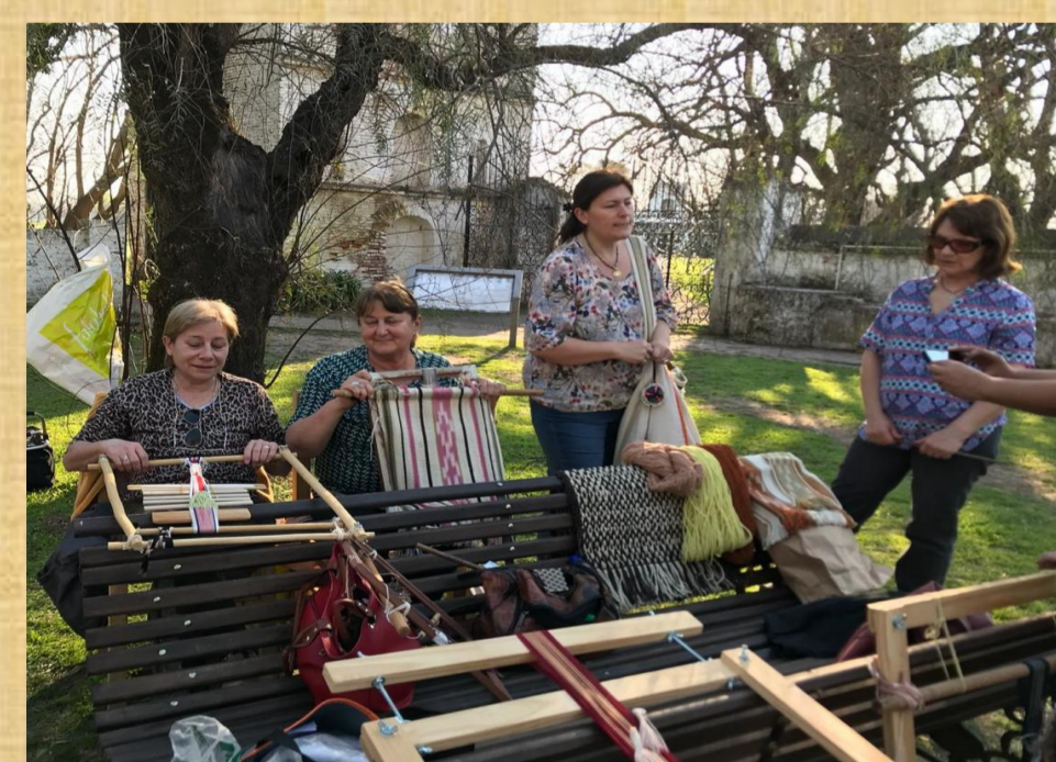
Taller Municipal "Telares Arequeros" Investigación En búsqueda de los colorantes de la Flora Nativa

En la actividad se expuso la temática abordada para dar a conocer esta nueva modalidad de trabajo científico participativo y para recopilar diversas inquietudes de parte de los integrantes de la comunidad como potenciales científicos ciudadanos y de nuestro equipo de investigación. En esta experiencia intervinieron los "científicos ciudadanos" de la localidad que se dedican a la producción de Textiles, Orfebrería y de Cerámica, todos ellos con conocimientos sobre tecnologías del pasado recuperadas y puestas en práctica en la actualidad. Además, se expuso de forma conjunta el conocimiento sobre la historia local a partir de la Arqueología de Campos de Batalla, el trabajo en el Archivo Histórico y la gestión del patrimonio.