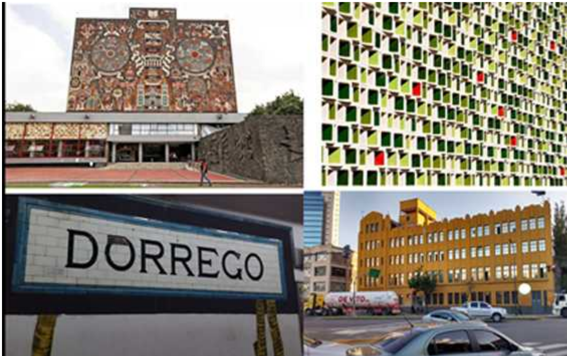
arriba derecha Escuela secundaria, Barcelona España arriba izquierda Universidad Nacional Autónoma de México abajo derecha Edificio Huergo 1433 C.A.B.A. foto E.C. abajo izquierda cartel cerámico de estación de subterráneo Dorrego, línea B, Bs As, foto: E.C.