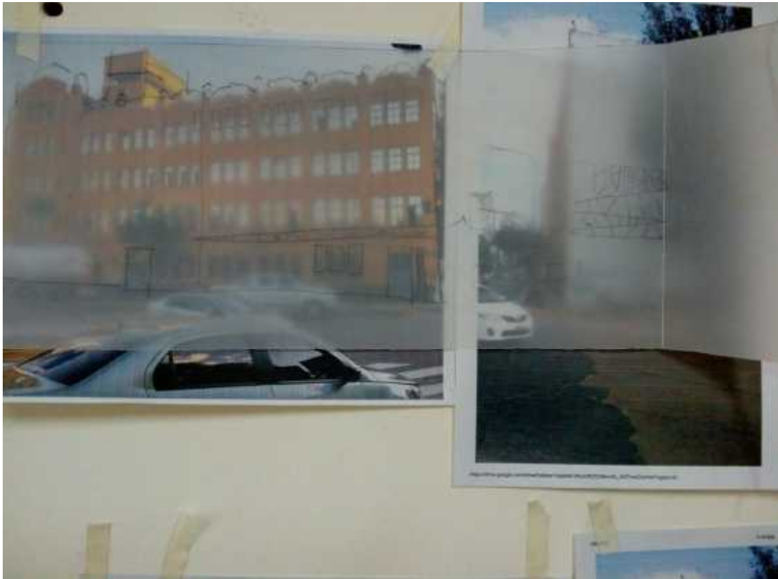
Intervención espontánea sobre foto, efectuada en encuentros de trabajo.