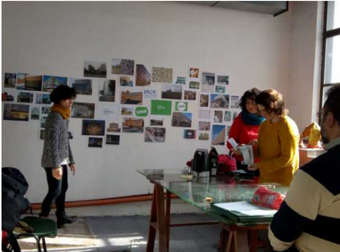
Registro de encuentros.

Otro de los factores de discusión fue: "¿Quién es nuestro espectador?". La situación urbana, el alto tránsito vehicular de la autopista, los escasos peatones que circulan la zona, los camiones: todos pasan y ven o pueden ver, pero ¿en cuál de ellos nos centraríamos para dirigir nuestra señal?