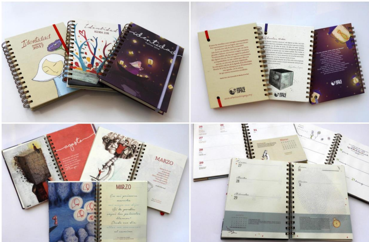
Tapas, contratapas, ejemplos de portadas y diagramación de interiores de las Agendas de la Identidad 2017, 2018 y 2019.

Luego de trabajar tres años consecutivos con este proyecto, se debe resaltar el compromiso de cada alumno en la resolución de la pieza editorial, que se evidencia no solo en la calidad gráfica y técnica de los prototipos, sino en el empeño por encontrar soluciones creativas y superadoras que posibiliten distinguirse de la edición anterior. Es destacable que los productos finales contienen detalles de edición de lujo como las tapas en cartóné laminadas, el anillado metálico y otras particularidades que difieren en cada propuesta.