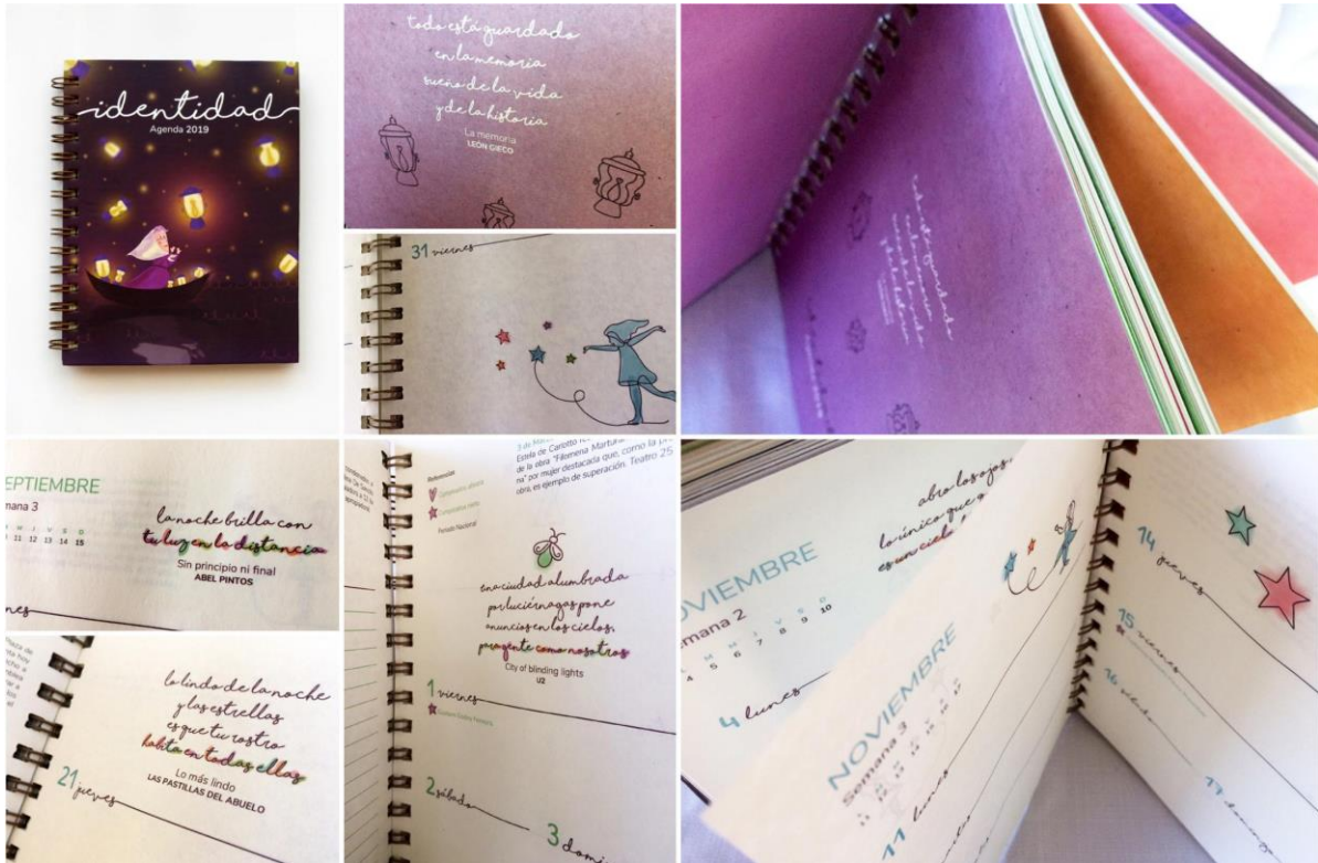
Agenda de la Identidad 2019. Tapa, pagina de guarda y página de cortesía; diseño y diagramación de interior y detalles de frases e íconos ilustrativos.