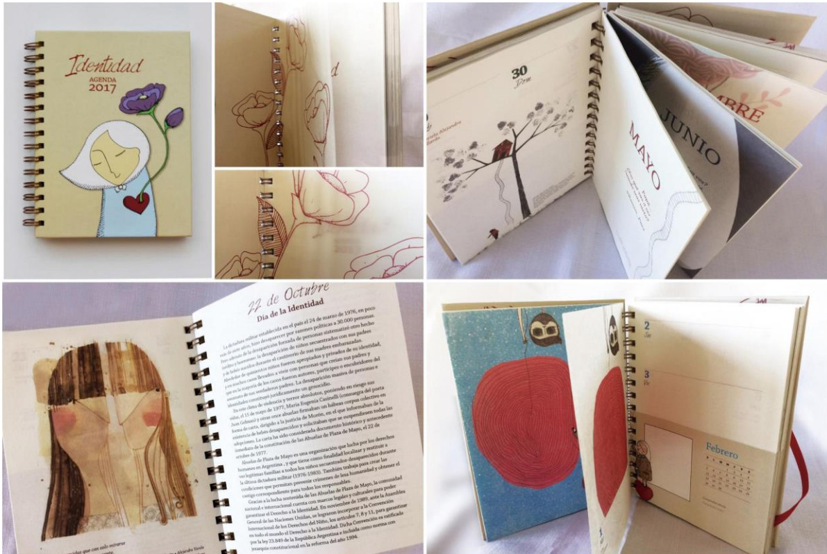
Agenda de la Identidad 2017. Tapa, detalles de página de guarda y página de cortesía; diseño y diagramación interior: portadas, páginas especiales y ordenador semanal.