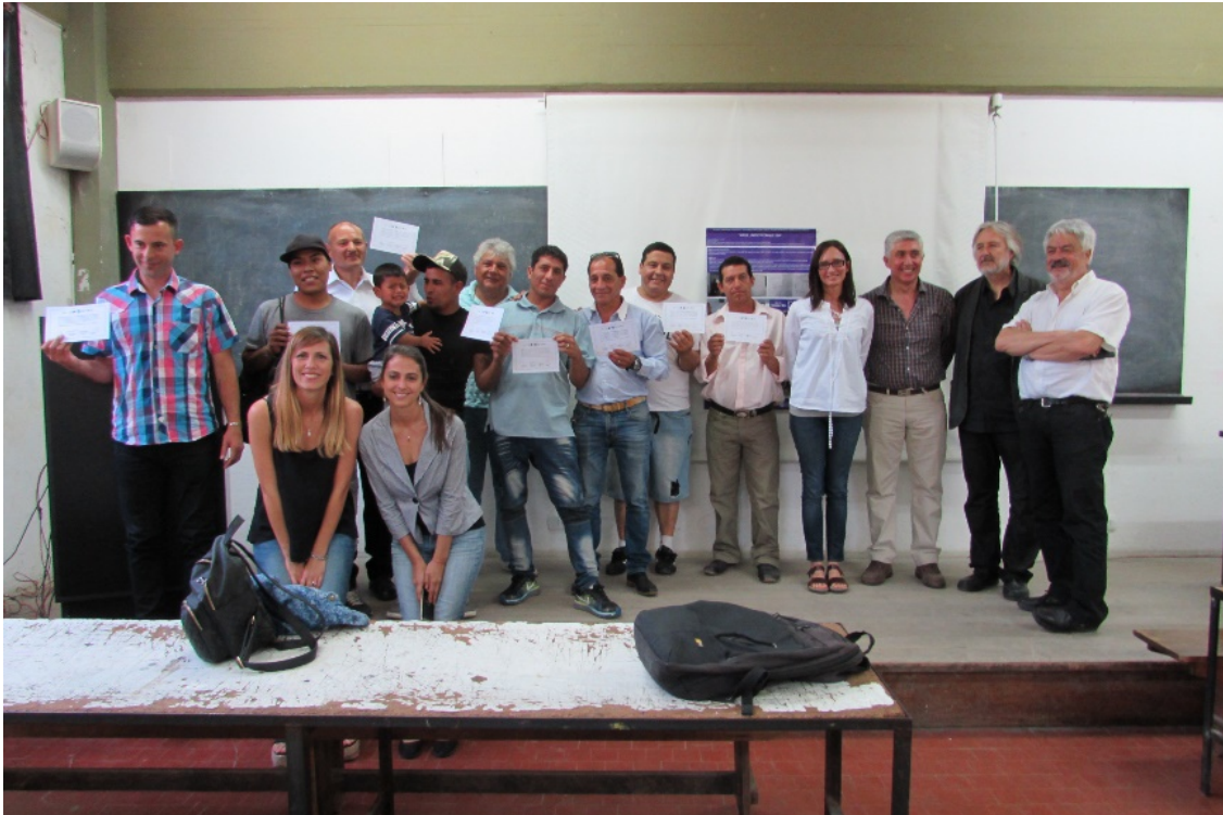
Figura 5. Cierre del Proyecto con autoridades de la FAU-UNLP + PLB