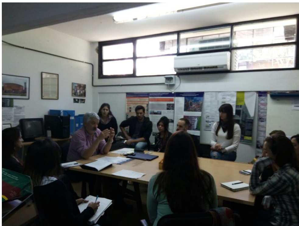
Figura 1. Reuniones preliminares con los alumnos en la FAU-UNLP.

El curso se desarrolla en uno de los Centros Integrales para la Inclusión Social del PLB –CIPIS 247 , en este caso el ubicado en la Avenida 122 entre 71 y 72 de La Plata. La propuesta es trabajar la idea de proyecto, como mensaje sistémico hacia el futuro, visto que es para la población destinataria el valor que particularmente quienes han sido privados de la libertad oportunamente más afectado o directamente destruido. La cárcel particularmente para los sectores sociales más postergados a veces opera como un vector contrario a los objetivos constitucionales que la originan para convertirse en un sitio sin horarios ni obligaciones, donde lunes y domingo o hacer o no hacer, da igual.