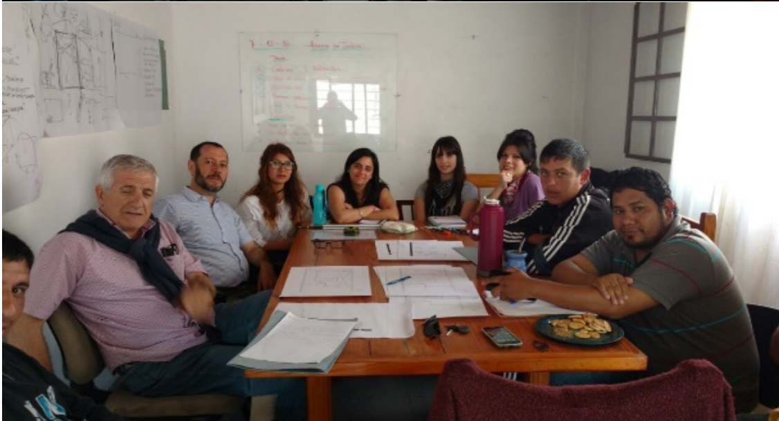
Figura 4. Encuentros FAU+PLB en el CIPIS-PLB. Fuente: Elaboración propia. 2017.