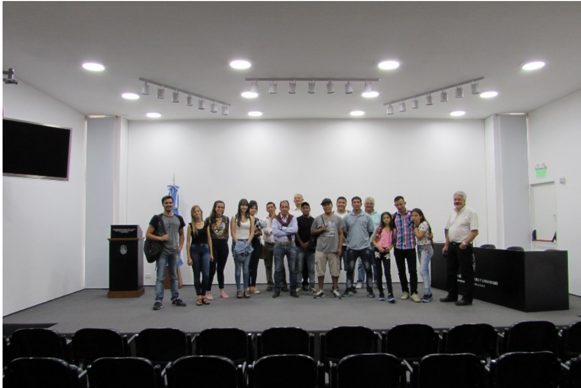
Figura 6. Visita de los tutelados a la FAU-UNLP.