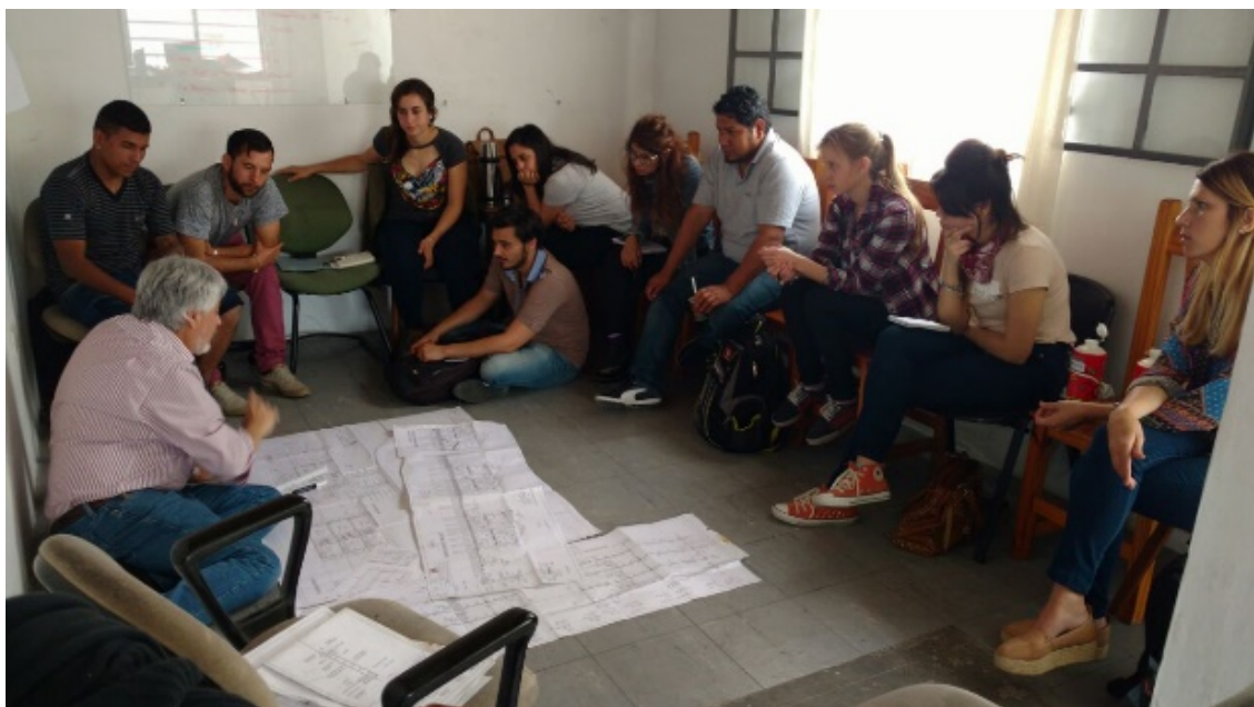
Figura 2. Encuentros FAU+PLB en el CIPI-PLB.

Por ello los cursos teórico prácticos que, sobre la base del aprendizaje del oficio de la construcción, mejoren la relación del tutelado con el medio se transforman en un objetivo en sí mismos. Entonces y más allá de la organización teórica que se esquematiza en un programa como el presentado, el trabajo se desarrolla sobre la base de la pregunta como herramienta y la idea de sistema como conjunto totalizador. La lógica relacional es la que permite a partir de una propuesta lanzada auscultar el interés de los cursantes y volcar en ideas gráficas, con ayuda del simple papel y marcador más las herramientas comunicacionales adecuadas, la devolución de la pregunta generada en otras que a su vez geométricen la dimensión (Figura 2).