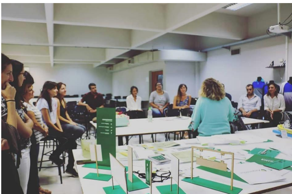
Evaluaciones de Tesis 2018/2019