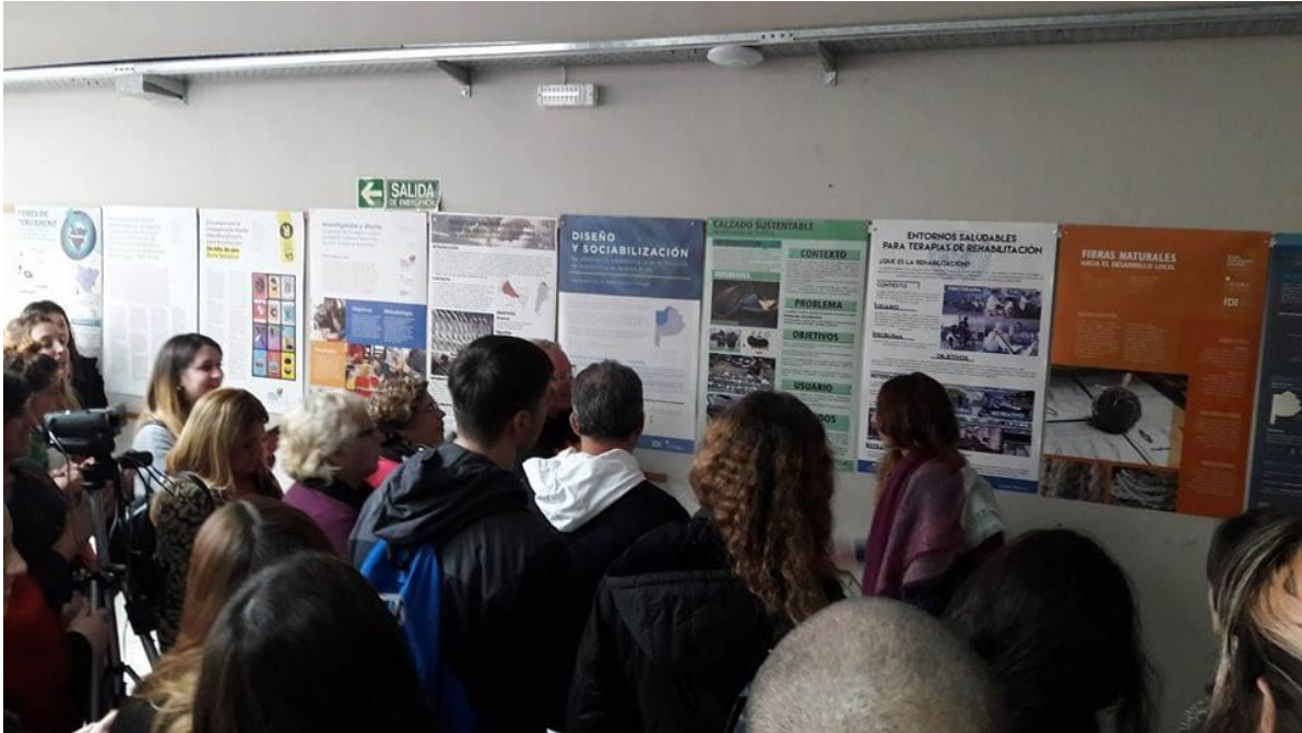
Ronda de Posters de Tesistas en el I Congreso de Diseño de la UNNOBA

Estos trabajos hicieron fundamental hincapié entre la diferencia de una idea y un tema de tesis, considerando idea como define la Real Academia Española” Primero y más obvio de los actos del entendimiento, que se limita al simple conocimiento de algo” y tema de tesis como abarcadora de una problemática contextual que supone el desarrollo de pautas para mejorar algún aspecto en ellas. Como sostiene Beatriz Galán la lectura del territorio reviste una importancia especial, pues es el lugar donde se encuentran los sistemas que sustentan las actividades comunitarias, reconstruyendo el momento original en que las relaciones de sentido fueron establecidas y validadas, propiciando la contextualización.