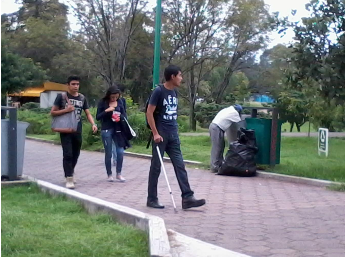
Caminando por CU. Foto: María Elena Jarquín Sánchez. Septiembre de 2014

El ejercicio de la movilidad está condicionado, en parte, por la posibilidad de contar con una infraestructura adecuada, pero un elemento importante es reconocer si se tiene alguna condición de salud que lo impida. De nuestro sondeo se extrae que casi 4% de las personas entrevistadas manifestó tener problemas físicos o de salud que limitaban sus posibilidades de lograr una movilidad libre. En general, estas se relacionaban con problemas de la visión muy acentuada en hombres heterosexuales y no heterosexuales, y lesiones en rodillas, columna, piernas y pies (más de un tercio de las mujeres heterosexuales y no heterosexuales) así como obesidad y sobrepeso (con proporciones similares entre mujeres y hombres heterosexuales). Estas condiciones de salud deberían ser consideradas en la implementación de programas que mejoren la vida de la comunidad universitaria-