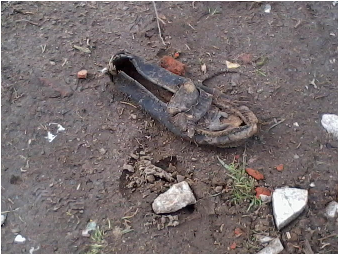
Perdido en el camino. Foto María Elena Jarquín Sánchez. Septiembre de 2014

“Y es que, por ejemplo, las calles son de forma circular, no de forma cuadrículada, y esto hace que sea muy peligroso el tránsito para los estudiantes y en general para los usuarios, ¿no?”