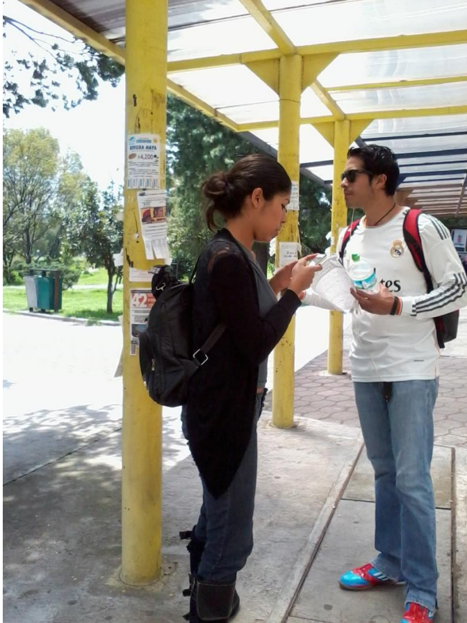
En el paradero del Pumabús, cerca de los bigotes.

Al principio de este trabajo se han mencionado algunas de las características con las que fue construida la CU. En el momento de la construcción, el campus central era relativamente pequeño y muchos de los espacios se planearon con la idea de que las personas pudieran transitar por ella caminando o bien a través de automóviles cuando se pensaba en recorridos más lejanos.