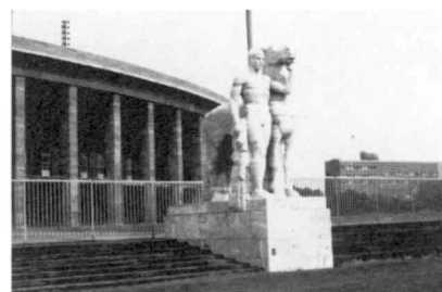
W. March, estadio Olímpico de Berlín