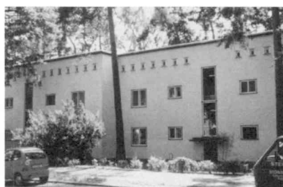
B. Taut, Siedlung onkel Tom, Berlín