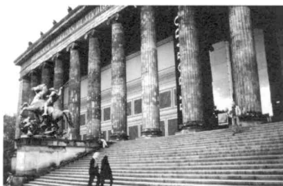
Schinkel, Altes Museum Berlín

Para que esto suceda es necesario haber construido una manera de convivir en la ciudad, tener resuelta una cultura urbana propia, que no solo significa culto y respeto por los grandes y magníficos edificios y espacios sino también hacia los ámbitos de vida cotidiana.