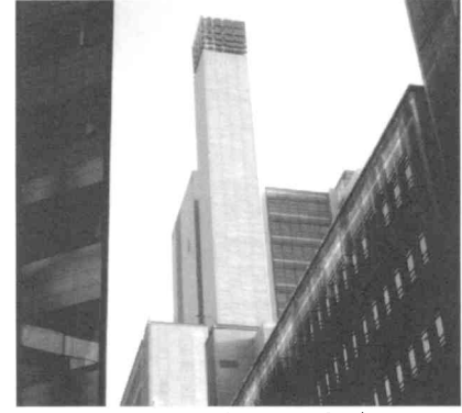
Renzo Piano, Daimler Benz, Berlín