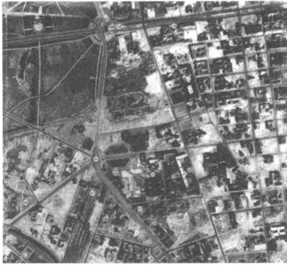
Fotografía aérea de Berlín, 1950

Una primera comparación con La Plata, ciudad que se apoya fundamentalmente en su trazado y su trama y se construye con arquitecturas de bajo perfil, heterogéneo, ecléctico, sin orientación morfológica ni proyección de imagen o lenguaje urbano y arquitectónico, nos pone frente a un Berlín que representa el caso opuesto, el de una organización urbana en la que la arquitectura, tiene mas presencia que la trama que la soporta. Los trazados se reconocen, se identifican por parte, asumiendo en general el vértigo de la historia y sus sucesivas re - construcciones.