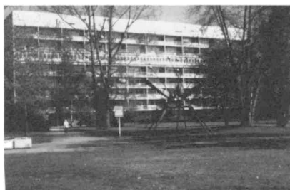
O. Niemeyer, Hansaviertel, Berlín

- Un primer momento en el trascurso del S XIX presenta la figura y obra paradigmática de Karl Friedrich Schinkel. Una arquitectura de reformulación del clasicismo monumental, en uno de los momentos históricos, de rico contenido en lo que hace a la manipulación libre y crítica de la forma y el lenguaje, en operaciones de gran potencia edilicia y urbana, todas sobre temas de alto valor representativo, por características del edificio y ubicación, del poder del estado en la forma de: «La Confederación Germánica» en ese momento de incipiente vocación de poder