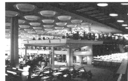
H. Scharoun, biblioteca estatal de Berlín

Flotan en ese medio otras obras de viejos sabios chamanes entre los que sin dudar, a riesgo de dejar cosas importantes de lado, señalaría dos obras clásicas con bien ganada fama, la Galería Nacional de Mies Van de Rohe y la Biblioteca de Hans Scharoun. Una creo la mejor obra de Mies, síntesis de espacio y materialidad en una arquitectura silenciosa, ingravida y sedante y el espacio central multifacético, infinito laberinto de profundidades y extensiones en el que la formas flotan con maestría de la biblioteca. Pero lo sublime es breve...y escaso ■