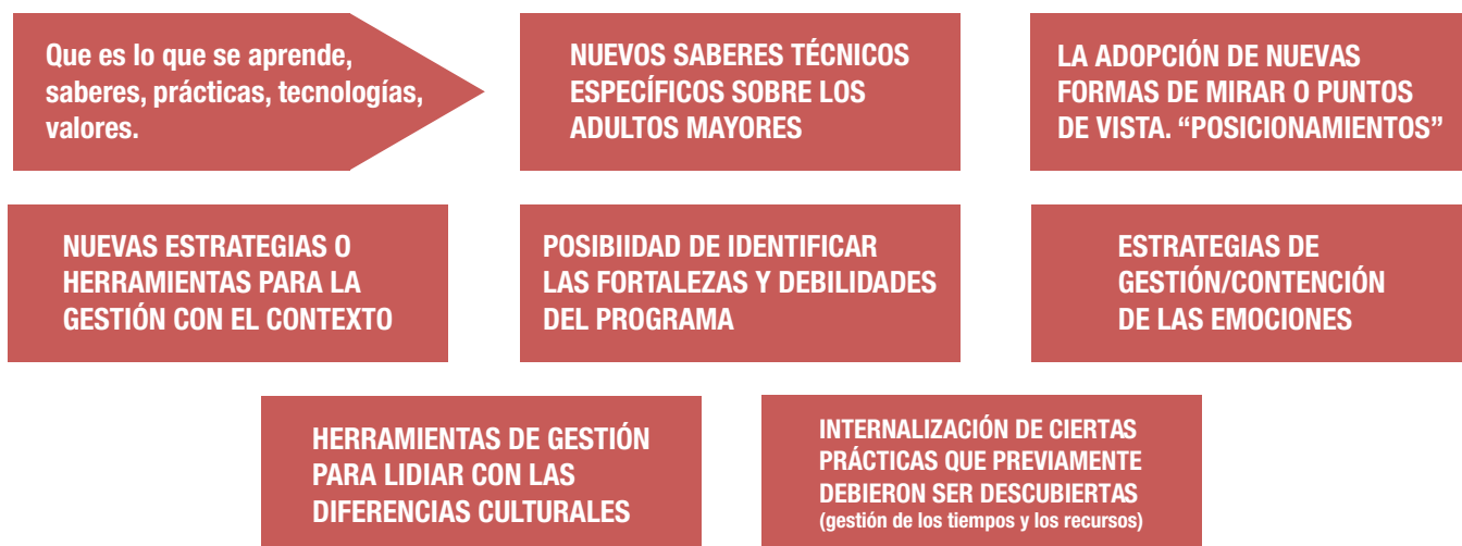
Gráfico 2. Tipos de Aprendizaje Organizacional

Cabe destacar como una reflexión adicional en relación con este proceso, que es la dificultad en los miembros de las organizaciones estudiadas de poder evocar e identificar los aprendizajes realizados a partir de la resolución de los problemas que enfrentan en la consecución de sus objetivos. También se pierde la noción de evolución a través del tiempo, no recuerdan con precisión las etapas/períodos/momentos en los que se reorientó la acción en función de los cambios propios o del contexto organizacional. Los aprendizajes no se registran, se naturalizan e incorporan al devenir cotidiano.