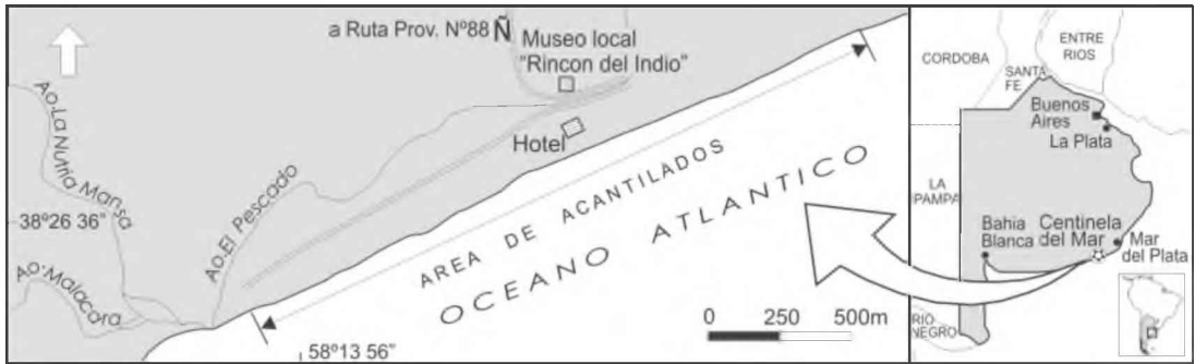
Fig. 1. Ubicación geográfica de la localidad Centinela del Mar

condición derivada para el grupo. Esta apreciación se fundamenta en el hecho de que las especies del género Basilichthys , como así también las especies basales de Odontesthes , son dulceacuícolas. Tanto las especies incluidas en el género Odontesthes como aquellas reunidas en el género Basilichthys constituirían grupos monofiléticos (Dyer, 1997).