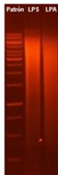
Figura 2. Corrida electroforética a 105V, 0,07 A y 7W. Patrón Fago \lambda cortado con HindIII.

A su vez, evaluamos los géneros bacterianos más comunes que presentan especies patógenas (Tabla 3). En ella, se destaca claramente el mayor porcentaje de Arcobacter spp. (10,691%) en agua, respecto al resto de los patógenos presentes. Mientras que en el sedimento se destacan géneros como Clostridium spp. (2,668%) y Leptospira spp. (1,802%). Cabe mencionar que en cercanías del sitio muestreado se diagnosticaron, en febrero 2015, casos de leptospirosis en adultos que habían estado en contacto con agua y/o sedimento del arroyo. La Figura 4 muestra la distribución de la diversidad bacteriana hallada en ambas matrices analizadas, observándose una mayor diversidad en el sedimento respecto del agua, sin embargo, vale considerar que la concentración bacteriana también resultó superior en el sedimento