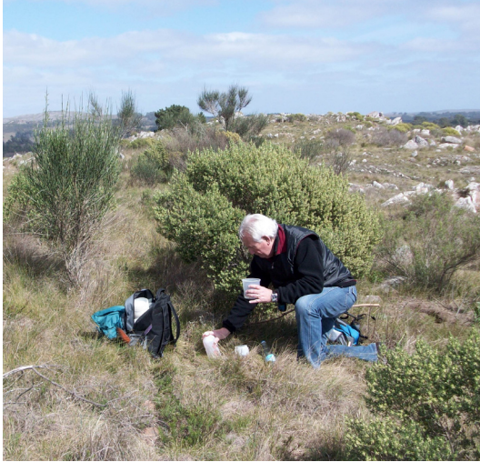
Fig. 2. Trampa de caída empleada en el muestreo en una sierra próxima a la ciudad de Tandil.

integran las sierras de Tandil como dato distribucional de las especies; y del material procedente de las tareas de muestreo desarrollada por los autores en el área estudiada, sectores serranos cercanos a la ciudad de Tandil. En este último caso se mencionan solo a aquellos especímenes que han podido ser determinados a nivel específico. En aquellos casos en que se mencionan especies no determinadas hasta este nivel, se comenta el por qué de su mención. Las colectas se realizaron con redes de arrastre, redes de golpe, trampas de caída y trampas de luz (Fig. 2).