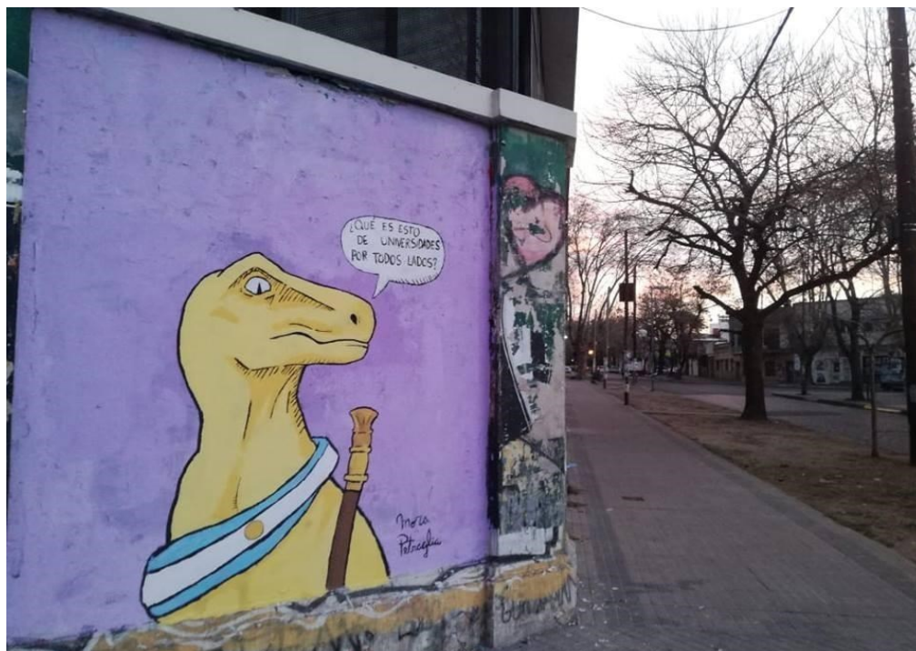
Figura 1. Pintura mural (2018), Mora Petraglia. Sede Fonseca, Facultad de Bellas.