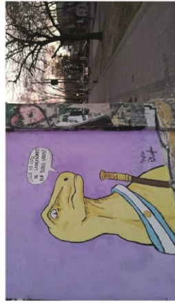
Figura 1. Pintura mural (2018), Mora Petraglia. Seefe Fonseca, Facultad de Bellas.