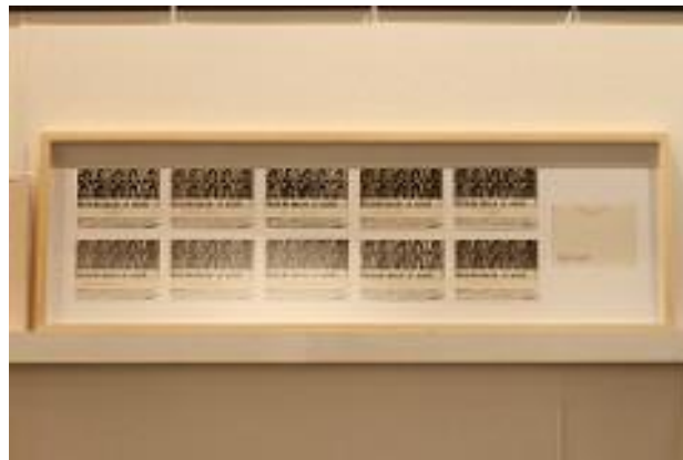
Mayer, A. (1978). Lo Normal. [Impresión offset sobre papel intervenida con sellos de goma]. Buenos Aires, Argentina: Museo de Arte Latinoamericano de Buenos Aires.