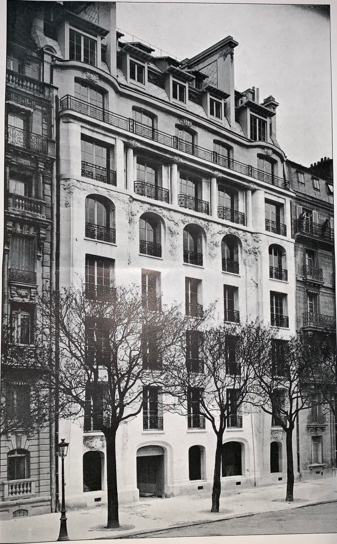
MAISON, AVENUE DE WAGRAM. — ARCHITECTES : MM. A. ET G. PERRET.