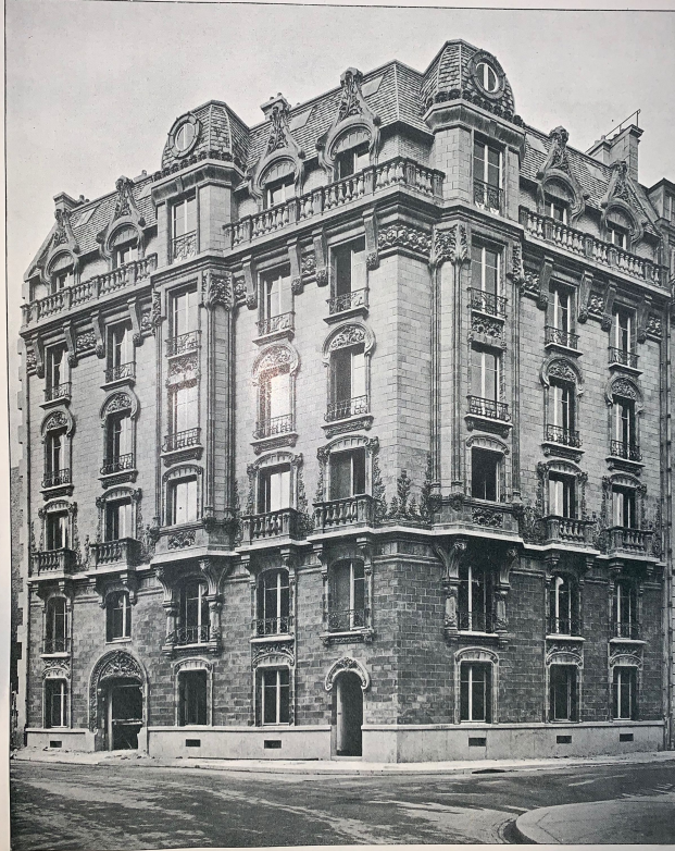
MAISON, RUE CLAUDE-CHAHU, A PARIS. — ARCHITECTE : M. CH. KLEIN.