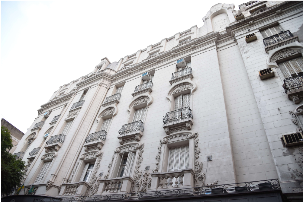
Fig 2. Hotel Victoria, Córdoba. Ing. Risler y Gross