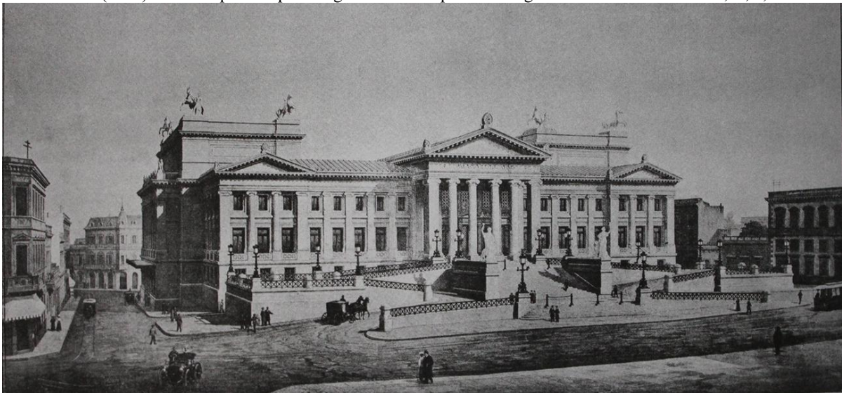
Fig. 3. Vittorio Meano, Proyecto de concurso para el Palacio Legislativo de Montevideo, 1904.