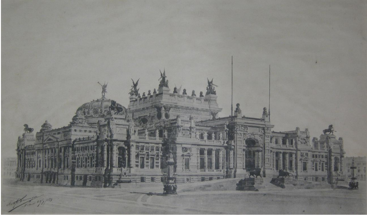
Fig. 2. Giuseppe Sommaruga, Proyecto de concurso para el Congreso de la Nación Argentina en Buenos Aires, 1895.