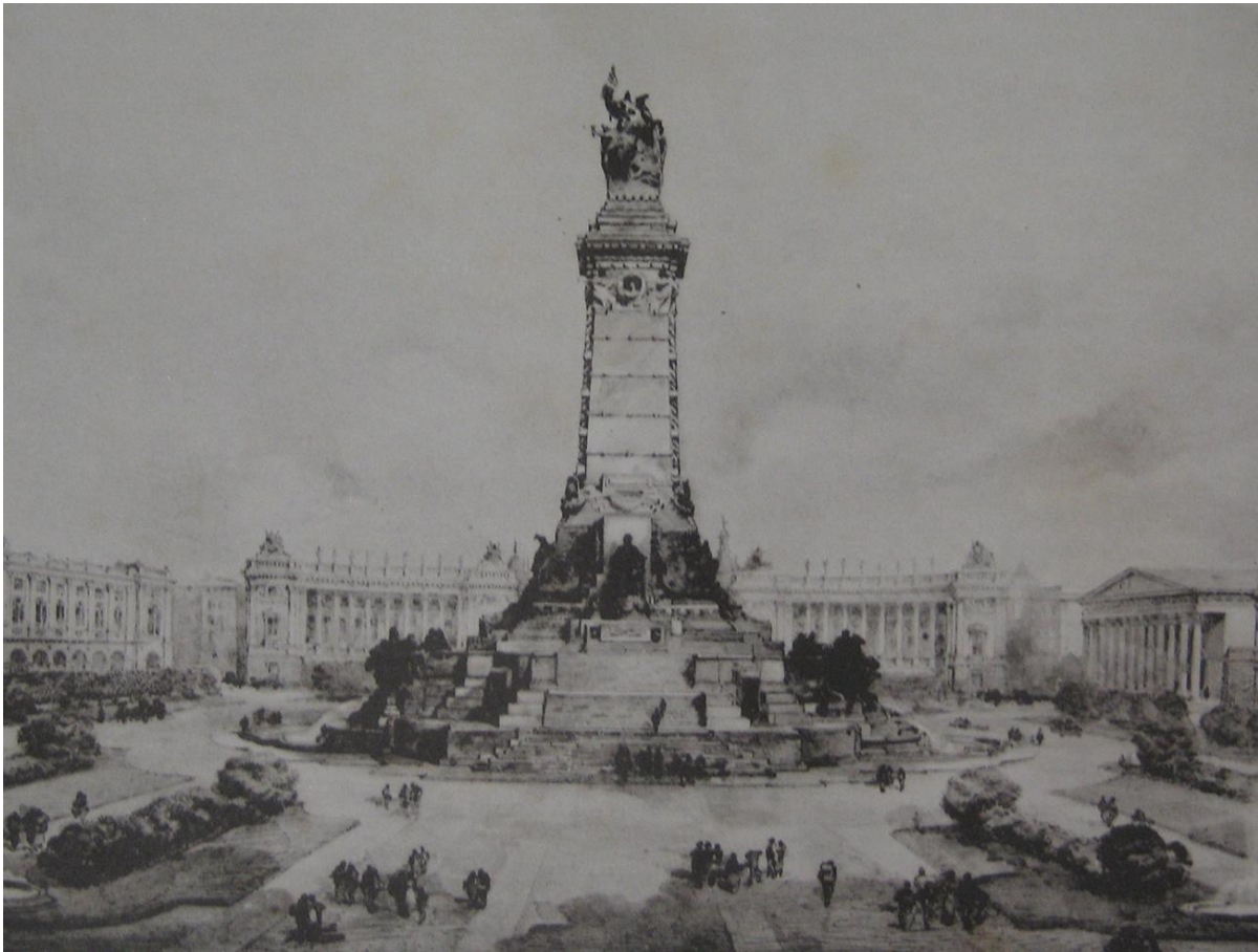
Fig. 5. Gaetano Moretti y Luigi Brizzolara, Proyecto de concurso para el Monumento conmemorativo de la Revolución de Mayo y de la Independencia Argentina, 1908.