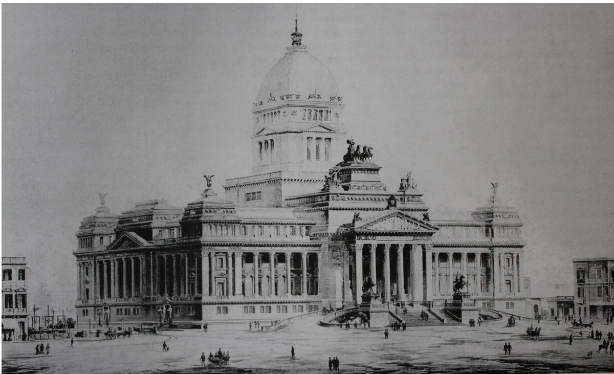
Fig. 1. Vittorio Meano, Proyecto de concurso para el Congreso de la Nación Argentina en Buenos Aires, 1895.

ZAGO, M. (Comp.) (1987). La Legislatura de Buenos Aires. Buenos Aires: Manrique Zago Ediciones