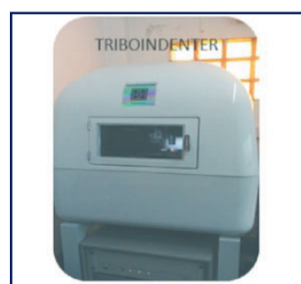
Figura 3: Nanodurómetro del Laboratorio de superficies Facultad de Ingeniería (INTEMA - CONICET - UNMdP)