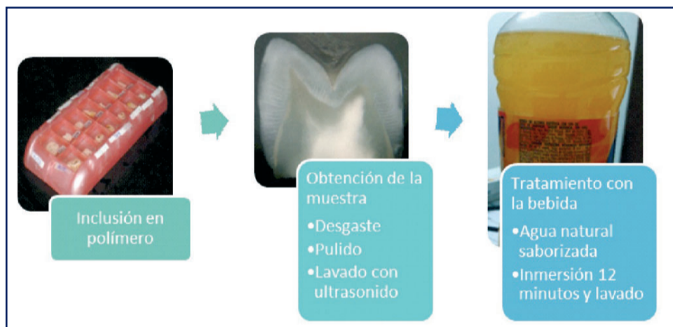
Figura 2: Procedimientos del experimento