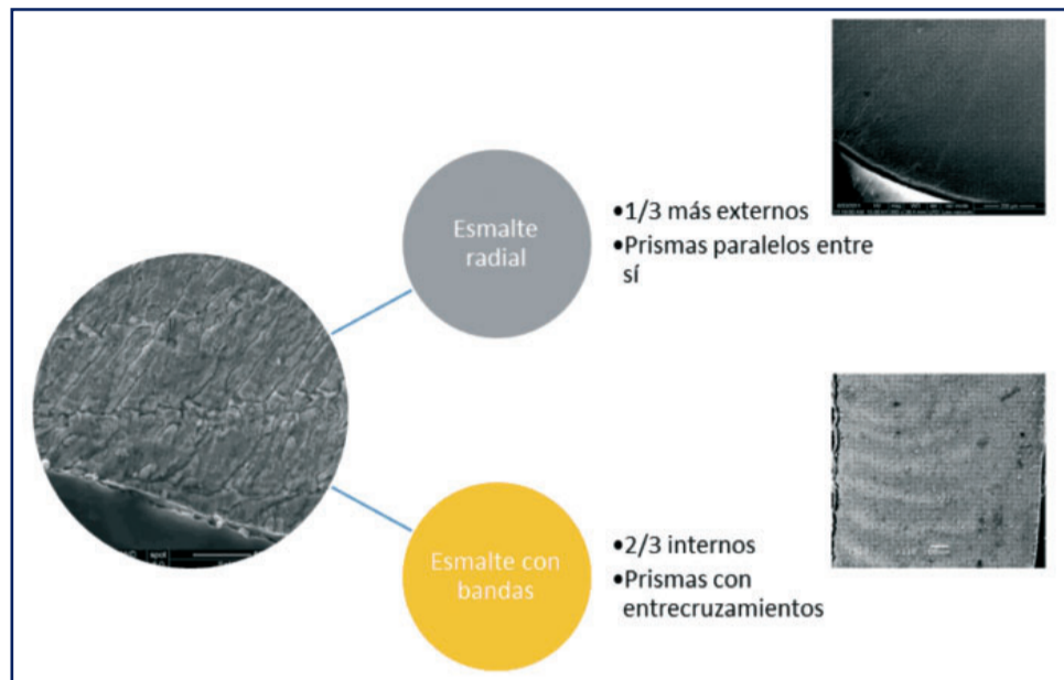
Figura 1: Microestructura del esmalte dental humano