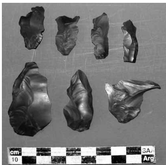
Figura 3. Lascas de adelgazamiento bifacial de sílex rojo con lustre térmico. Unidad 4.

Bifacial thinning flakes of red chert with thermal luster. Unit 4.